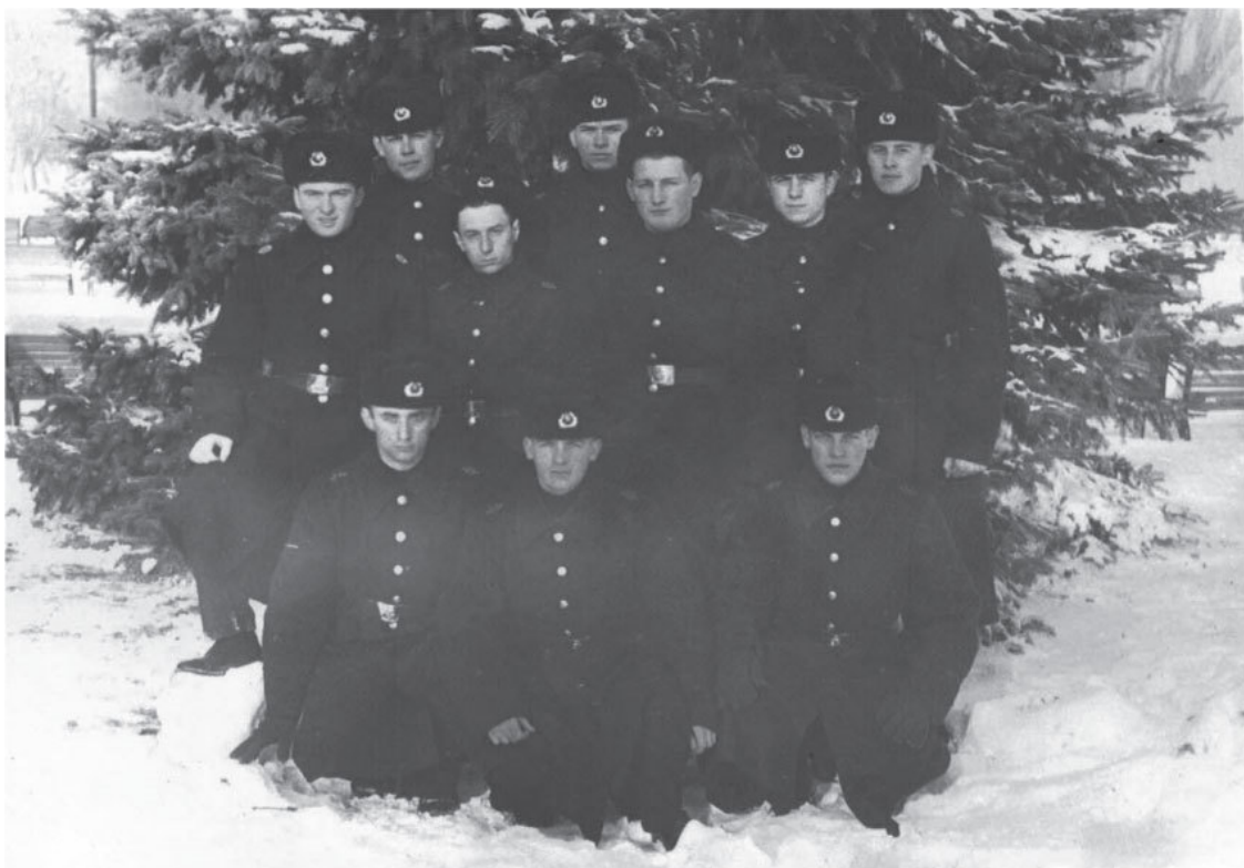
Весна 1983 года, г. Николаев