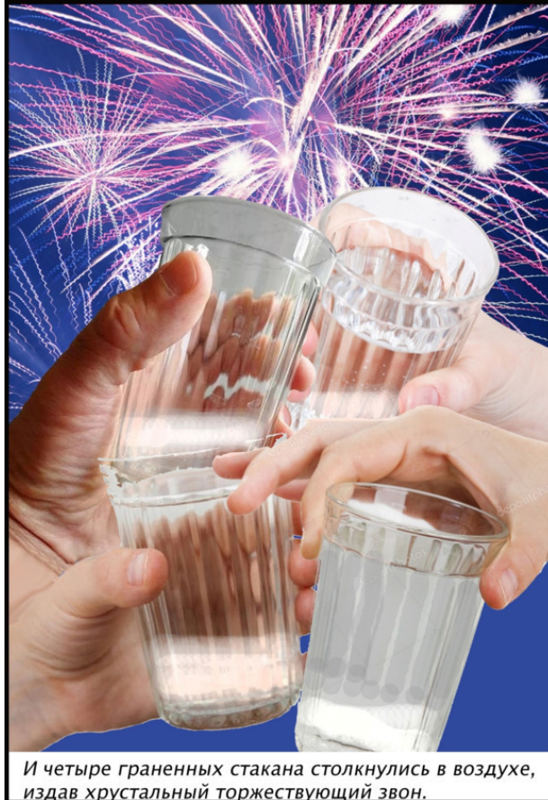
И четыре гранёных стакана столкнулись в воздухе, издав хрустальный торжествующий звон.