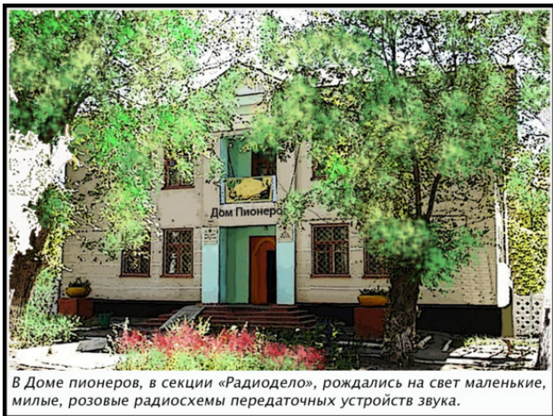
В Доме пионеров, в секции «Радиодело», родились на свет маленькие, милые, розовые радиосхемы передаточных устройств звука.

С этим морем мы дышали полной грудью. Кислородное голодание нам было неведомо. Пусть голодают и задыхаются другие.