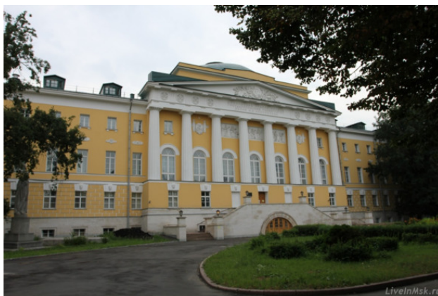
Здание МГУ на Моховой, где до революции учился дедушка Ося

Там я видела фото: дедушка с соучениками в прозекторской, у препарированного трупа, а кто-то при этом ест бутерброд – такое считалось в среди медиков – студентов высшим шиком!