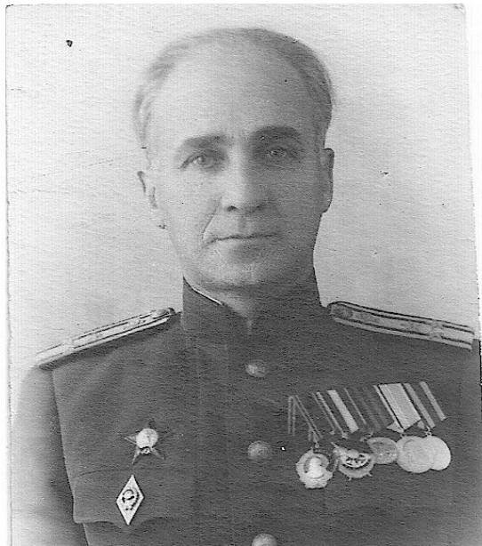
Фронтвик, полковник, кавалер ордена Ленина И. М. Броудо