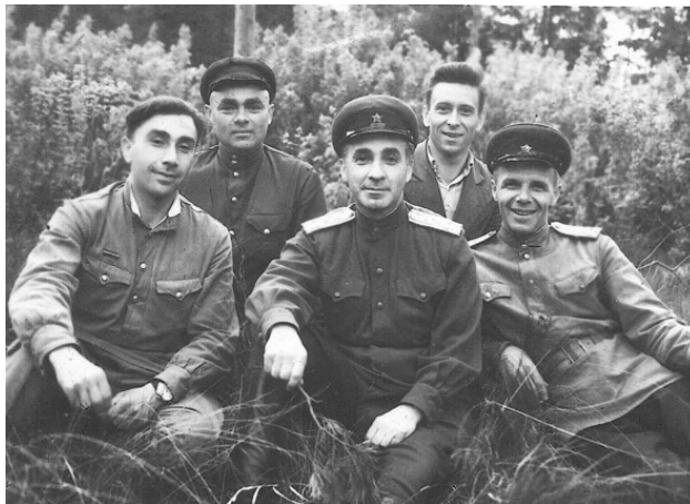
С коллегами – военными врачами, после войны