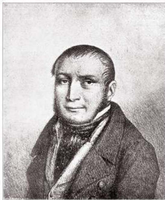
1.2. Луи Шарль де Лабурдоннэ 1797—1840.