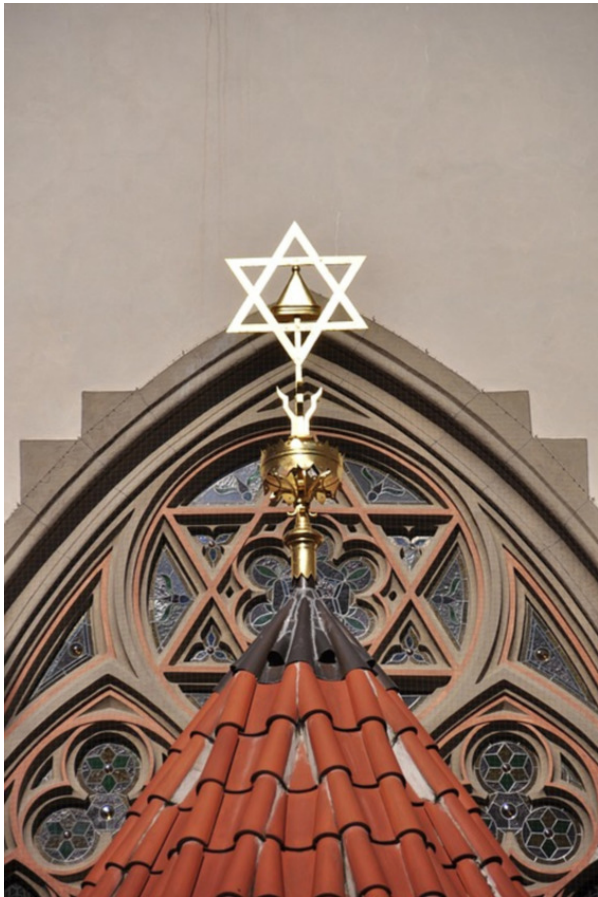
Испанская синагога Праги