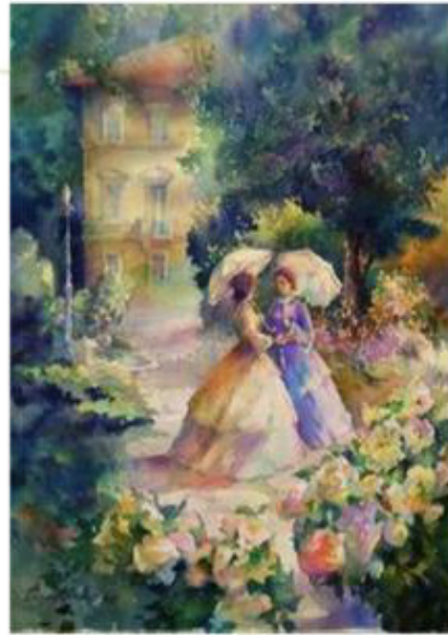
They go for a walk [зэй го-у фо э вок] они идут гулять.