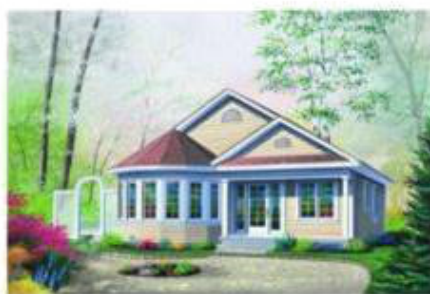
my country house [май кан-три ха-уз] моя дача