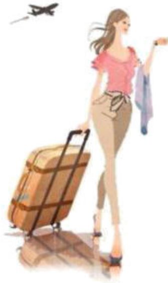
She goes to London [ици го-уз ту лан-дон] она едет в Лондон.