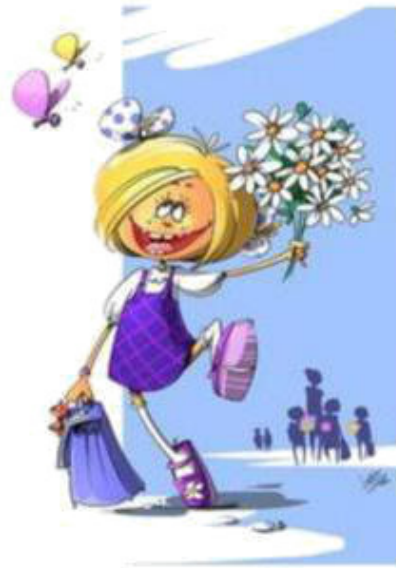
She goes to school [ици го-уз ту скул] она идёт в школу.