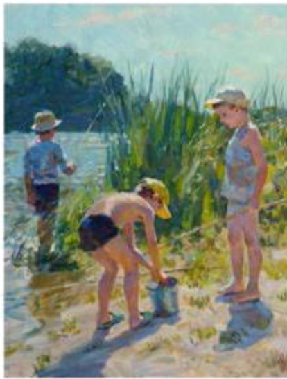
my friends [май фрэндз] мои друзья