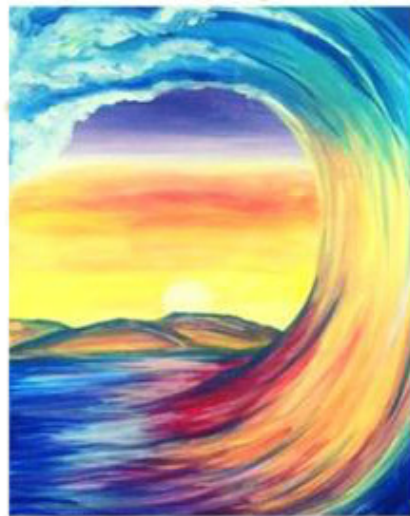
The life must go on [з ла-йф маст го-у он] жизнь должна продолжаться.