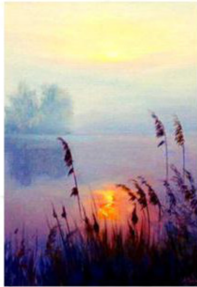
The sun goes up [з сан го-уз ап] солнце встаёт.