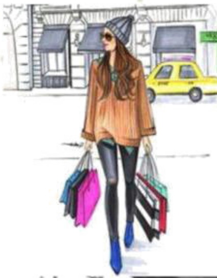
She goes shopping [щи го-уз шо-пинг] она идёт по магазинам.