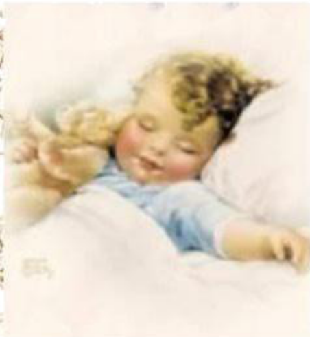
my brother [ бра-за ] мой брат