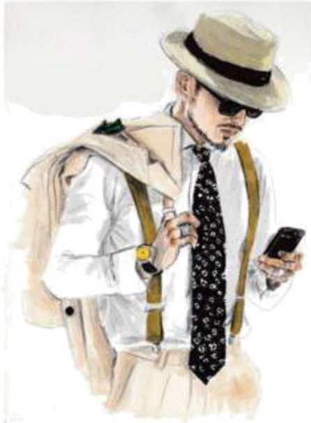
my father [ май фа-за ] мой папа

Иногда (Sometimes) [ самтаймз ] мы с бабушкой (my granny and I) [ майгрэни энд ай ] не гуляем (walk) [ вок ] в (in) [ ин ] лесу (the forest) [ з форэст ].