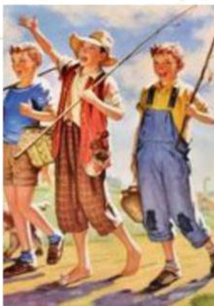
They go fishing [зэй го-у фи-шинг] они идут на рыбалку.