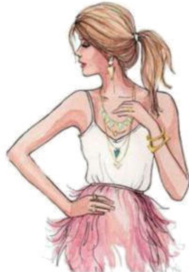
my mother [ май ма-за ] моя мама