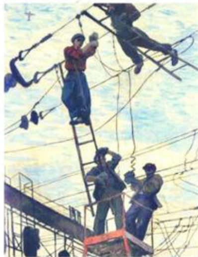
They go for broke [зэй го-у фо бро-ук] они работают изо всех сил.