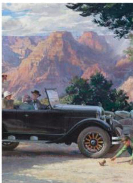
They go on holiday [зэй го-у он хо-ли дэй] они едут отдыхать.