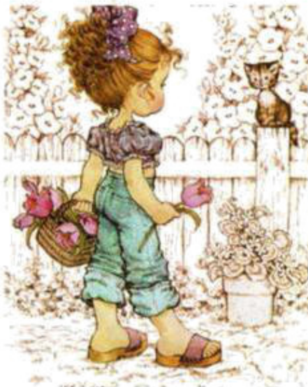
my sister [ май си-ста ] моя сестра