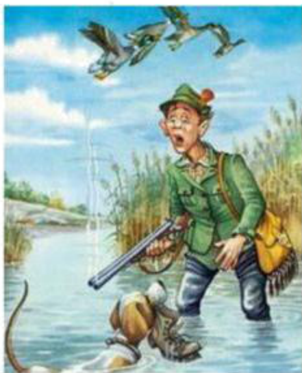
He goes hunting [хи го-уз хан-тинг] он идёт на охоту.