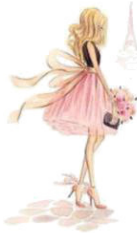
She goes to Paris [ици го-уз ту пэ-рис] она уезжает в Париж.