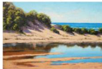
the river [з ри-ва] ре-чка