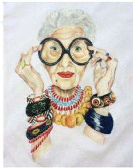
my granny [май грэ-ни] моя бабушка