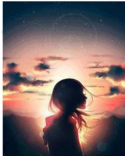
The sun goes down [з сан го-уз да-ун] солнце заходит.