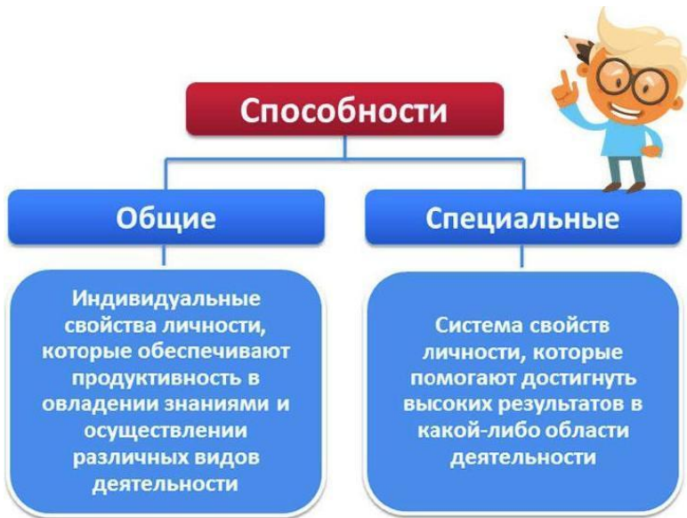
Рис. 1.1. Классификация способностей

Источник: Ермолаева-Томина Л.Б. Психология художественного творчества. М.: Академический Проект, 2003. 256 с.