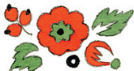
Иллюстрация Т. Юратова, О. Васильева