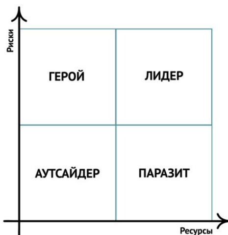
Рис. 2. Лидерские психотипы на основе «Бостонской матрицы»

На основе «Бостонской матрицы» рассмотрим базовые стратегии мышления у людей. По оси «у» – у нас будут риски, по оси «х» – ресурсы. В своей жизни мы принимаем решения на основе некоторых стратегий. Стратегии являются производными нашего мышления. Какие-то их них закладывались в нас еще предками 2—3 тысячи лет назад и являются базовыми, какие-то воспитаны окружением: родные, школа, универ и так далее.