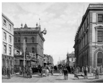
Джордж стрит. Сидней, 1883

Большая часть этого светского общества, в англосаксонских странах в особенности, проводит почти все свое время в отыскивании предков и фабрикации генеалогических деревьев, корни которых должны брать начало по меньшей мере в средних веках. Австралийцы этого не делают... как и все представители рода человеческого, они тоже имеют предков, но... многие из них предпочли бы их не иметь. Происхождение их из Нового Южного Уэльса или Тасмании такое чувствительный вопрос, которого касаться не следует. Вольтер сказал, что человек должен быть очень заботливым в выборе себе предков, австралийцы же не следуют этой мудрой рекомендации, ибо, как известно, первые колонисты Нового Уэльса и Тасмании были каторжниками... Таким образом, австралийцы в генеалогии своей интересуются лишь двумя предшествовавшими им поколениями.