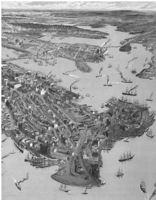
Город Сидней, 1888 M.S. Hill (разворот, левая часть)

Предметы роскоши имеются в изобилии, и они немного дороже, чем в Англии, а большинство продуктов стоят дешевле.