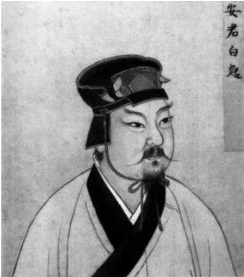
Бай Ци – известный генерал царства Цинь в период Чжаньго