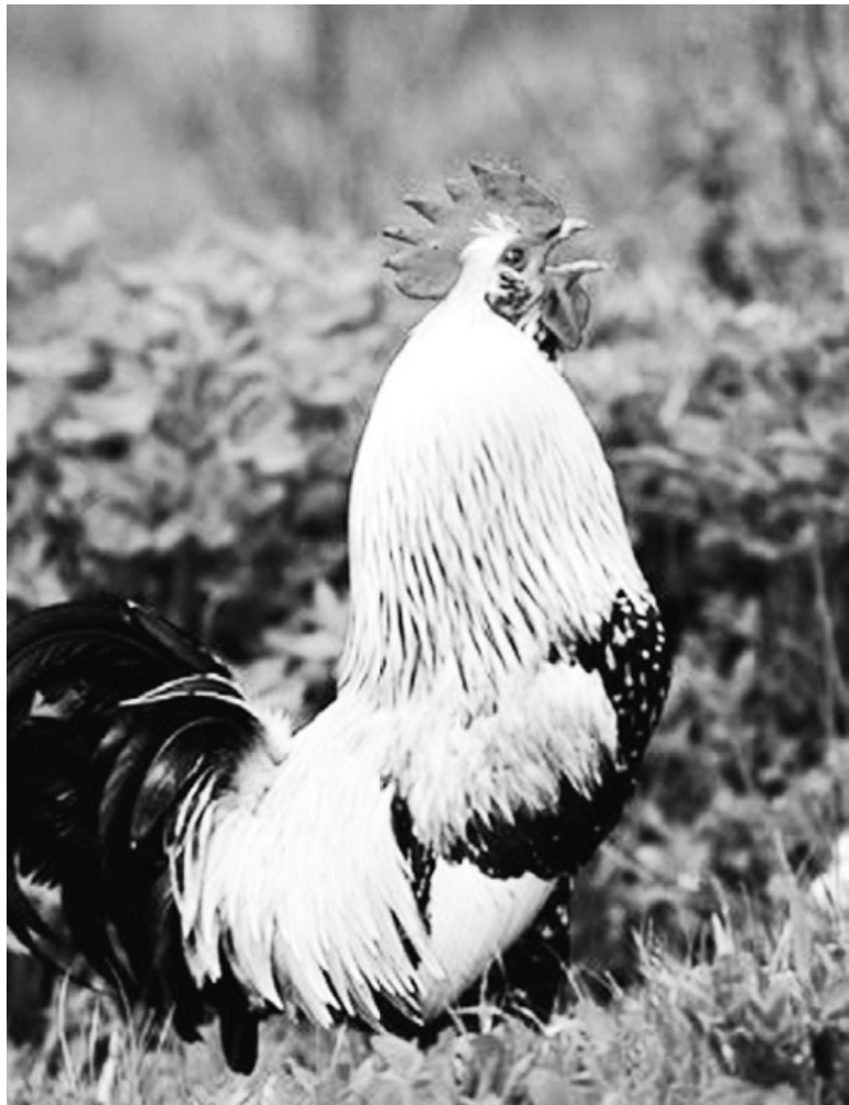
На расеее петух кукарекает на лугу