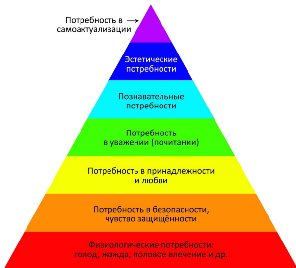
Рис.1. Пирамида потребностей Маслоу.

Но не все знают, что подобная существует и в питании. Изначально она разработана Министерством сельского хозяйства США в 1992 году. На самом нижнем уровне находится то, что мы должны есть каждый день, так называемая основа нашего питания, на вершине – то, что нужно максимально сократить.