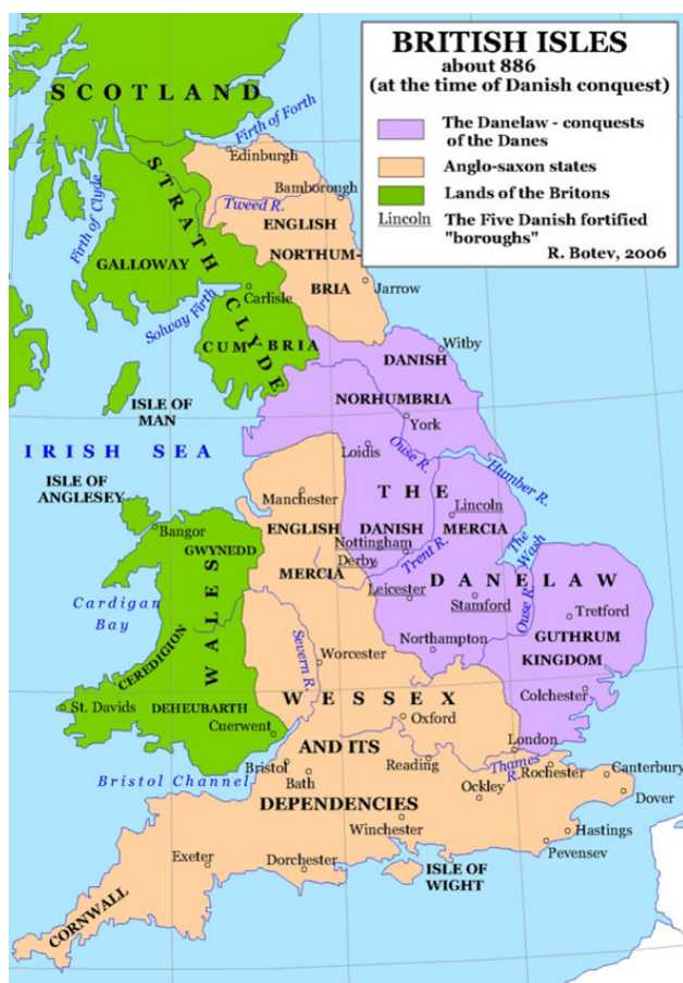
Британские острова в период правления Альфреда Великого

в самые дальние места Европы и, по-видимому, приложил немалые усилия, чтобы собрать всю информацию о северных морях, посещавшихся ранее датскими и норвежскими моряками, которые совершали дальние плавания в этом направлении.