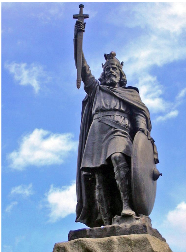
Статуя Альфреда Великого в Винчестере

Альфред настолько серьезно относился к этому национальному проекту и так усердно им занимался, что перед своей смертью имел флот уже из ста двадцати кораблей, пол-