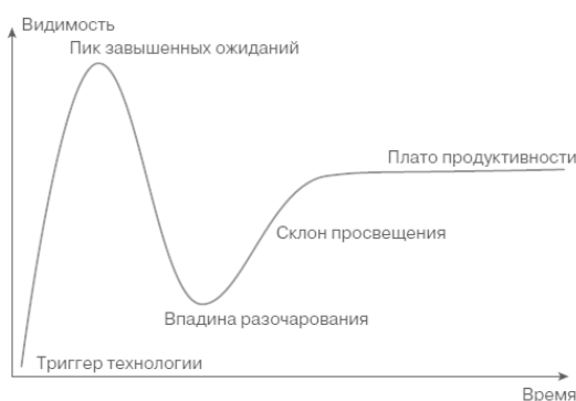
Рис. 1.1. Кривая разочарований

Возможным подтверждением этого являются оценки компании Standish Group в отчетах CHAOS Manifesto 2013–2015 гг., где она неожиданно снизила рейтинг использования Agile в проектах, сведя его применение к «малым проектам».