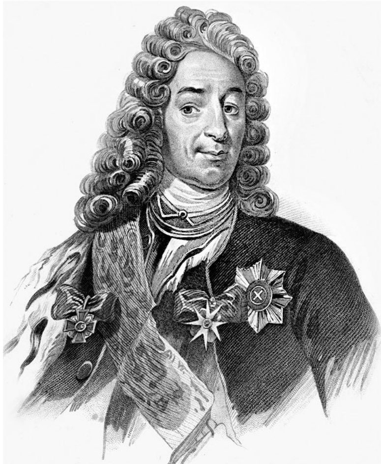
А. Д. Меншиков