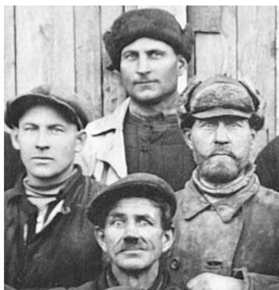
Рис. 4. Вверху папа накануне отъезда