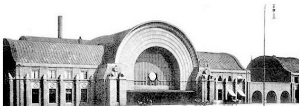
Рис. 6. Выборгский вокзал в 1940 году.

«Спасибо!» сказать. И не помыслил, что это чужая игрушка, что ею играл чужой финский мальчик, и ему, наверное, жаль её, горько, как жалко и больно бывало и мне, если мальчишки у меня отбирали игрушки. Для меня мальчика этого тогда не было вовсе. Я был рад, и мне сейчас стыдно за это. Но так было... Мы прежним путём вошли в дверь вокзала с улицы как будто на первый этаж, а очутились вновь на втором под переплётками огромного свода. И тут меня словно током ударило: «Как же так? В городе толстые кирпичные стены разрушены, а здесь стекло даже не треснуло», – а уж как легко бьются стёкла – это я знал. И недоумению моему не было никакого предела.