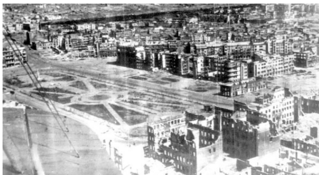
Рис. 5. Руины Выборга

спешно покинутый финнами! Для чего? Что он этим хотел показать? Мощь советского Воздушного Флота? Над городом, не прикрытым ни зенитками, ни авиацией. Н-не п-понимаю! Абсурд!