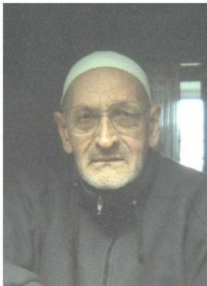
Рис. 1. На мир взираем поумневшим взглядом

Памяти всех павших безвременно в войнах.