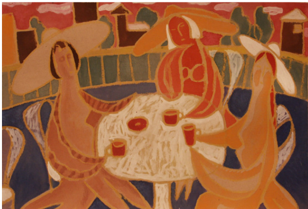
«В кафешке» картон. смеш. тех. размер 40*30 см 2007 год