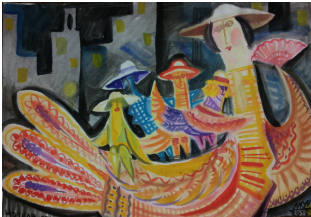
«Ночные прогулки» бум акварель размер 40*60 см 2015 год