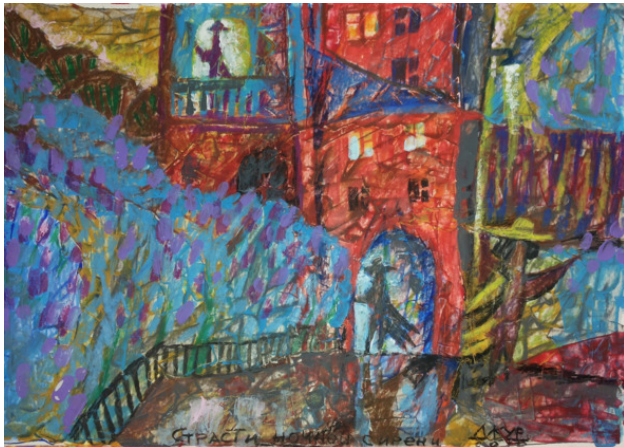
«Страсти ночной сирени» бум акрил размер 40*60 см 2015 год