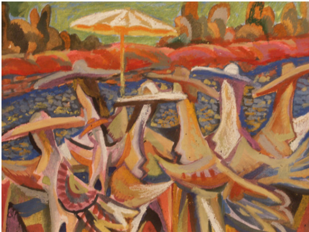
«Суета» бумага. смешанная техника, раз 40 *30 см 2010 г.