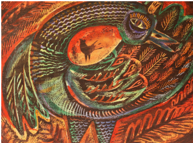
«Птенчик» бумага, граттография, размер 40 *30 см, 2002 год.