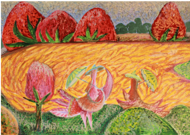
«Абрикосовая река, клубничные берега» бум смеш. тех. размер 40*60 см 2007 год.