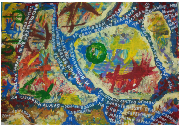
«Что слышится за шорохом листвы...» бум. смеш. тех. размер 40*60 см 2015 год.