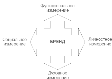
Рис. 1.5. Концепция четырехмерного бренда

Личностное измерение. С помощью наших товаров мы поддерживаем стремления человека, даем ему возможность раскрыть свою индивидуальность, сделать себе приятное, проявить свои таланты и лучшие стороны своей личности.