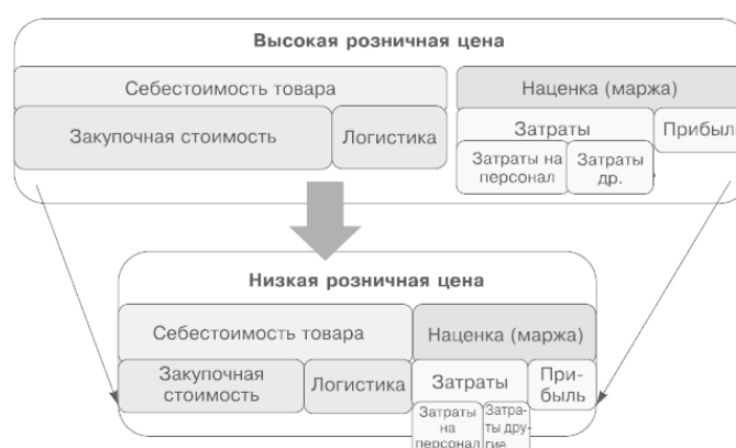
Рис. 1.2. Стратегия снижения цен

Главная задача таких ритейлеров – найти возможность дальнейшего снижения цен (рис. 1.2).