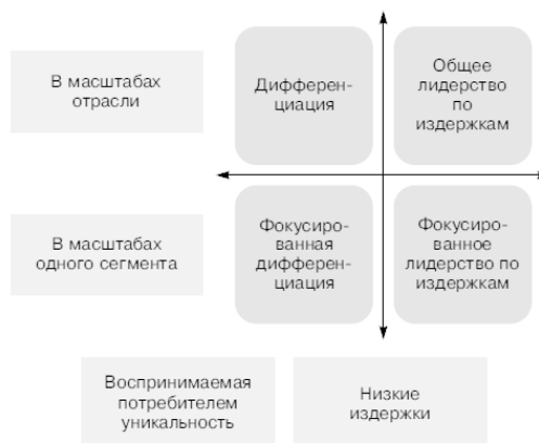
Рис. 1.1. Базовые стратегии на существующих рынках

Остановимся на видах конкурентных стратегий , предложенных М. Портером (подробнее об этом см. в главе 2). Определите, какой тип стратегии использует ваша компания и в чем это проявляется (рис. 1.1).