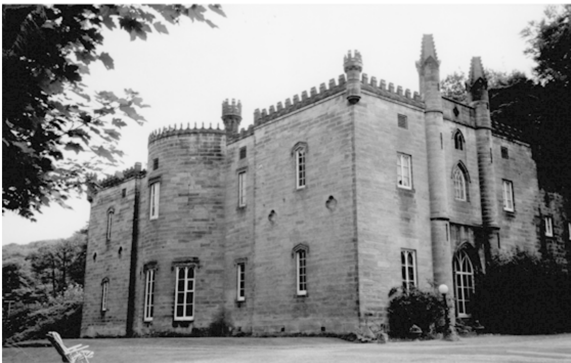
Хостел (ныне «Клифф-парк-холл», частный дом на озере Редьярд), где Оруэлл остановился 3 февраля 1936 года. Дом был построен около 1811 года и в 1933–1969 годах служил общежитием для молодежи. Он мог вместить сорок шесть мужчин и двадцать женщин

С трудом нашел хостел, милей дальше. Опять один в комнате. Любопытнейший дом. Большое, мрачное, насквозь продуваемое здание, построенное около 1860 года по чьей-то прихоти в виде замка. Все комнаты, кроме трех или четырех, пустуют. Мили гулких каменных коридоров, никакого освещения, кроме свечей; готовят на коптящих керосинках. Страшный холод.