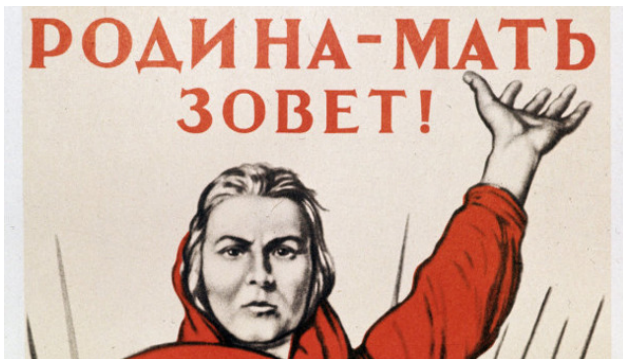
Плакат «Родина-мать зовёт!»

не в этом... Не в материальном мире! Он в песнях, картинах, в том, что не передашь обычными словами, только так: «Пусть ярость благородная вскипает как волна... Идет война народная, Священная война...» – вот Образ народа Русского – в песне, в музыке... Боже мой, какая музыка, вот он готовый Гимн России на все времена! У кого-то не поднимается волна в душе, у кого-то не бегут мурашки по телу, не наворачиваются слезы на глазах?! Батенька, да вы не славянин и, тем более, не Русский! «Родина-Мать зовёт!» – просто плакат, даже не картина. Но какой Образ!