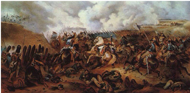
Батарея Раевского. БОРОДИНО. Худ. Франц Рубо

Символ нестигаемости Русского Духа, Образ СИЛЫ Русского Воина! «Умрём, но не отступим! Россия большая, но позади Москва!» – все эти фразы – не просто слова. И неважно, при каком государстве Русские защищали Родину, Отечество: при Александре Первом или товарище Сталине. Это звучало из Души Русского Воина! Так сложилось, что и в Первую Отечественную и во-Вторую Отечественную, на этом Поле Русские обороняли Москву-Матушку, Сердце Городов русских, Центр Духовности, святое место для любого Русского (правда, до недавнего времени, теперь этот город больше ассоциируется с огромным «денежным мешком» и Автора это сильно пугает... Но об этом позже!). Главное, что эти фразы произносили и рядовой православный из армии Барклая в 1812-м году, а затем те же слова исходят из Души рядового атеиста советской армии в 1941-м году. Жива Русская Душа, жив Русский Характер! Государ-