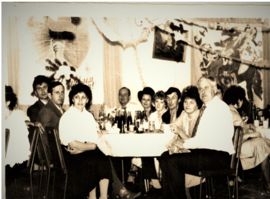
Встреча Нового 1986 года. Уч-Арал