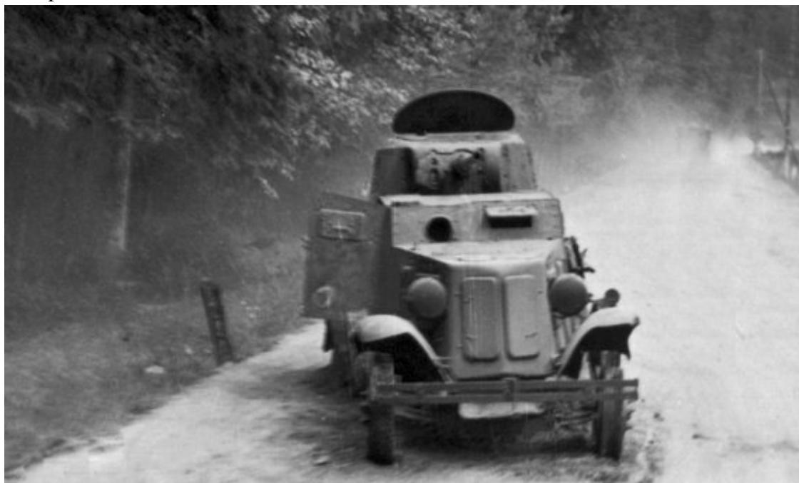
Сгоревший броневедомитель «БА-10» на дороге перед г. Львов в районе Голоско (Holosko), 29–30 июня 1941 года

В действительности прямая проекция опытов с ведром на танки была не совсем обоснованной. Статистически танки с дизельными двигателями не имели преимуществ в пожаробезопасности по отношению к машинам с карбюраторными моторами. Попадание снаряда было куда более мощным средством воспламенения, чем обычный факел, и дизельное топливо при этом загоралось точно так же, как и бензин.