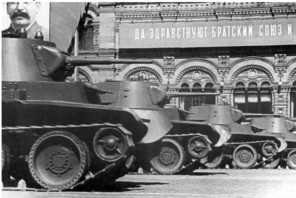
Танки «БТ-7» на первомайском параде. Танки «БТ» и «Т-26» составляли основу бронетанковых войск Красной Армии в 1941 году

Их прославляли в фильмах – таких, как «Горячие денечки», «Если завтра война», «Истребители», «Эскадрилья номер пять», и других. Романтичные образы танкистов и летчиков создавали такие суперзвезды советского кино, как Николай Крючков, Николай Симонов. Крючков в «Трактористах» играет демобилизовавшегося танкиста, для которого «на гражданке» открыты любые дороги. Ключевой момент фильма – рассказ его героя, Клима Яркого, колхозникам о скорости и мощи танков. Картина завершается сценой свадьбы танкиста и лучшей девушки колхоза. В финале вся свадьба поет популярнейшую песню тех времен «Броня крепка, и танки наши быстры». «Горячие денечки» рассказывают о танковом экипаже, остановившемся для ремонта в деревне. Главный герой – командир экипажа. Он – бывший пастух. Только служба в армии открыла перед ним широкие перспективы. Теперь его любят самые красивые девушки, на нем роскошная кожаная куртка (до середины 30-х годов советские танковые экипажи носили черные кожаные куртки, из «царских» запасов). Разумеется, в случае войны герой будет громить любого врага с той же легкостью, с какой покорял женские сердца или достигал успехов в боевой и политической подготовке.