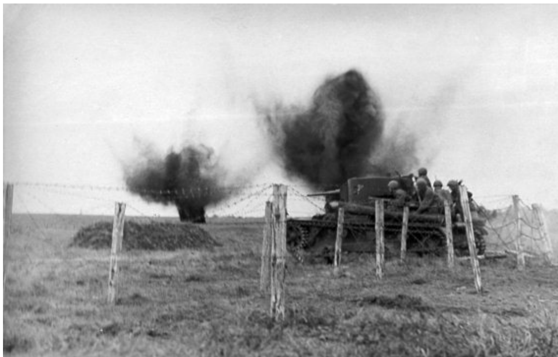
«Т-26» в атаке

Младшие специалисты – командиры танков, механики-водители, командиры орудий, радисты-пулеметчики – готовились в учебных батальонах и школах младшего командного состава. В связи с формированием большого количества новых соединений была создана дополнительная сеть курсов в округах и армиях, однако этого оказалось недостаточно. Положение усугублялось тем, что многие новые танковые части создавались на базе стрелковых и кавалерийских частей и соединений. Была организована массовая переподготовка кадров: пехотинцы, кавалеристы, артиллеристы, связисты становились... механиками-водителями танков, наводчиками и другими специалистами танковых войск. В короткие сроки решить такую задачу было невозможно. В результате новые экипажи к началу войны не успели овладеть техникой, многие механики-водители, например, получили всего лишь 1,5—2-часовую практику вождения танков. Катастрофически не хватало командного состава. Укомплектованность большинства мехкорпусов, сформировавшихся весной 1941 года, по командно-начальствующему составу составляла 22–40 %, а по младшему – от 16 до 50 %. На 1 июня 1941 года в штабах 15, 16, 19-го и 22-го мехкорпусов не были укомплектованы даже такие отделы, как оперативные и разведывательные!