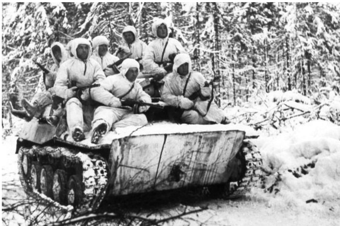
Разведчики 1-й мотострелковой дивизии, вооруженные «ППШ», «ППД» и карабином, на танке «Т-40». Декабрь 1941 года