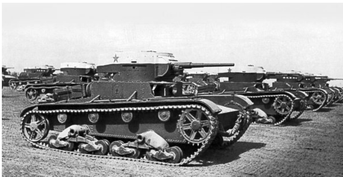
«Т-26» на маневрах Киевского особого военного округа. 1935 год

На этом фоне легко воспринималась пропаганда о непобедимости Красной Армии. Люди искренне верили, что «врага будем бить малой кровью на чужой территории». Грядущая новая война – война моторов создавала и новые пропагандистские образы. Если десять лет назад каждый мальчишка представлял себя верхом на коне с шашкой в руке, мчащимся в стремительной кавалерийской атаке, то к концу 30-х годов этот романтический образ был навсегда вытеснен летчиками-истребителями, сидящими в скоростных монопланах, и танкистами, управляющими грозными приземистыми боевыми машинами. Надо сказать, что первое бронетанковое соединение – механизированная бригада была создана в СССР в 1930 году, а уже к середине 30-х их было несколько десятков. В августе 1938 года механизированные бригады, имевшие на вооружении танки «БТ» и «Т-26», стали именоваться легкотанковыми, а бригады, получившие на укомплектование танки «Т-28» и «Т-35», стали называться тяжелыми танковыми бригадами. Соответственно были переименованы в танковые и механизированные корпуса.