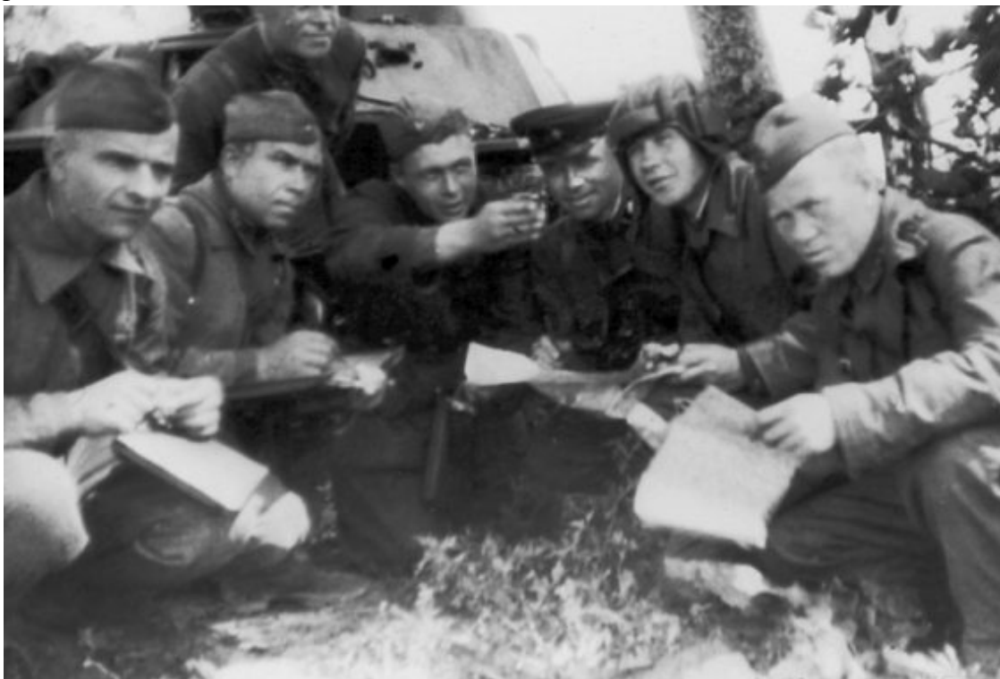
Постановка задачи на фоне танка «Т-40»