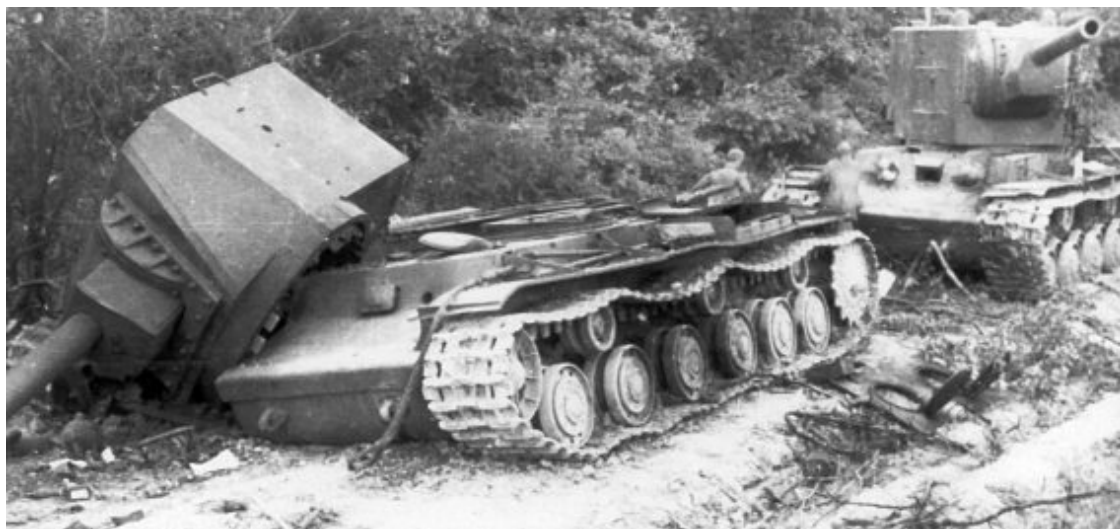
Два танка «КВ-2» из состава 8-го тд 4 мк, брошенные и подорванные в полосе действий 97-й лпд ГА «Юг». Июнь 1941 года, район северо-западнее Львова. На переднем плане участник еще советско-финской войны 1939–1940 танк «У-3» – четвертая машина в серии «КВ».