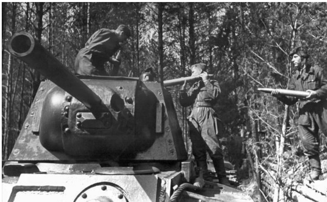
Загрузка снарядов в танк «КВ-1»

сто нервное возбуждение – на месте не сидится. Ротный сопит, шмыгает». Конечно, были и другие страхи, кроме страха смерти. Боялись быть искалеченными, ранеными. Боялись пропасть без вести и попасть в плен.