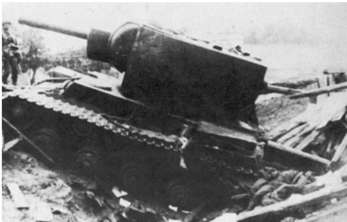
Брошенный «КВ-2» в районе Дубно