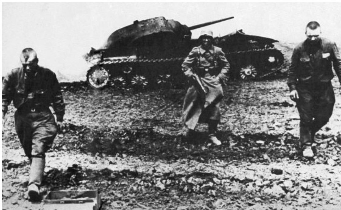
Немецкий солдат конвоирует захваченных в плен советских бойцов на фоне уничтоженного внутренним взрывом «КВ-1»