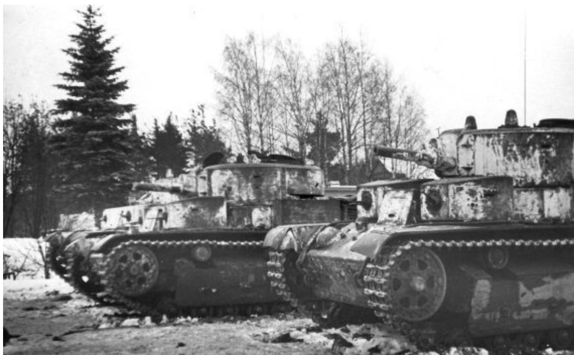
Танки «Т-28» перед атакой. Карельский перешеек, февраль 1940 года