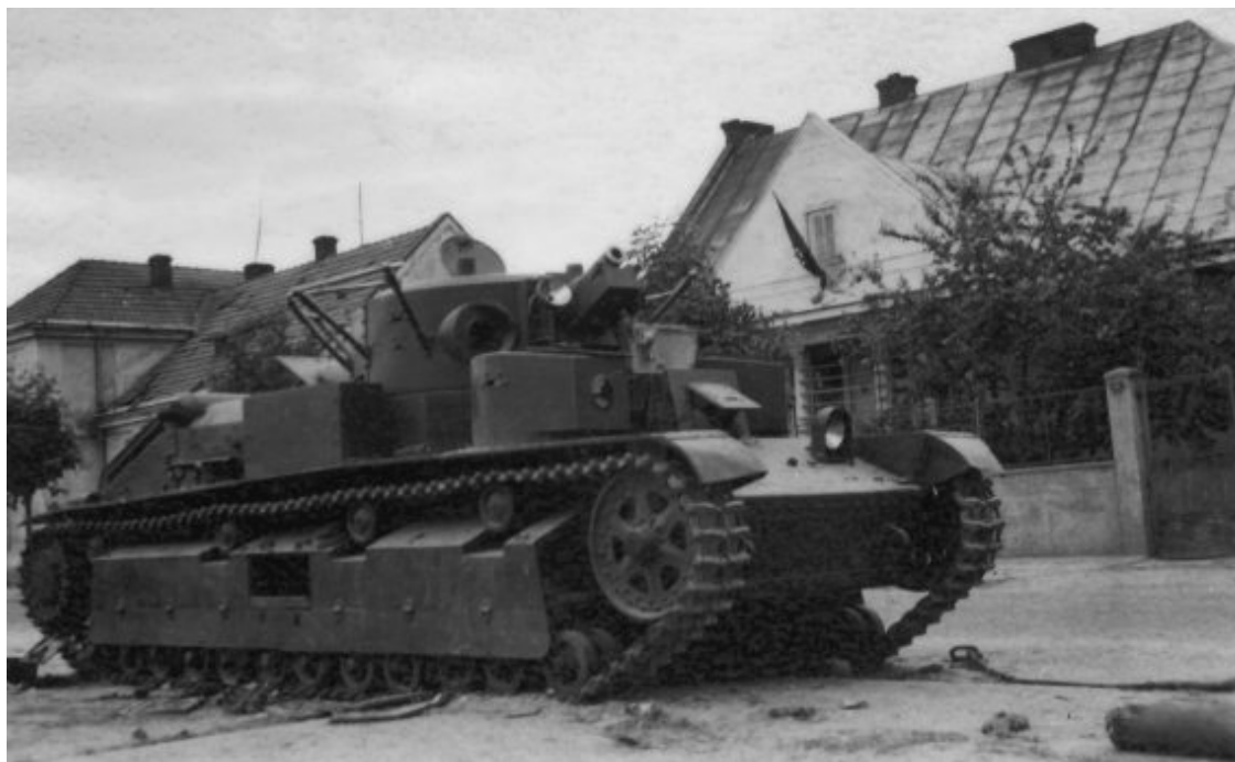
Оставленный при отходе из Львова танк «Т-28» (с поручневой антенной и орудием «КТ-28») из состава 8-й тд 4-го мк. Лычаковская улица, Львов, 30 июня 1941 года