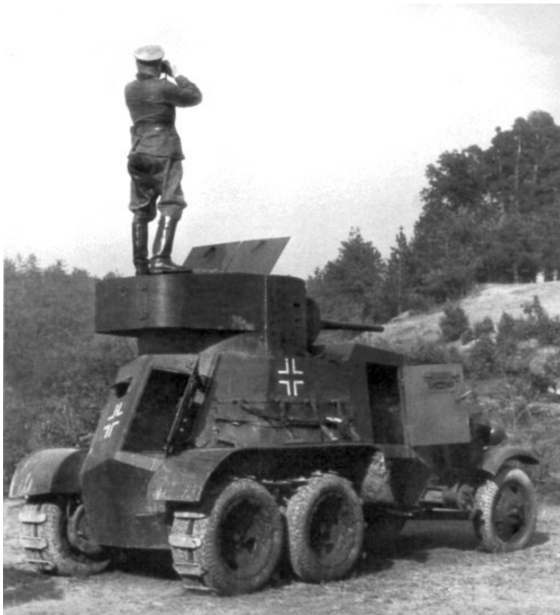
Немецкий офицер осматривает местность с захваченной бронемашины «БА-10»