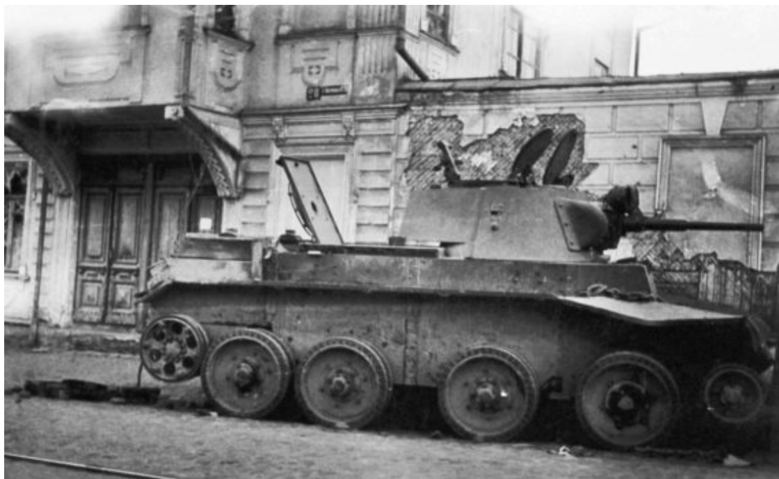
Танк «БТ-7» (с зенитной установкой «П-40» и фарами боевого света) из состава (вероятнее всего) 1-й тд в г. Псков на улице Лиона Поземского