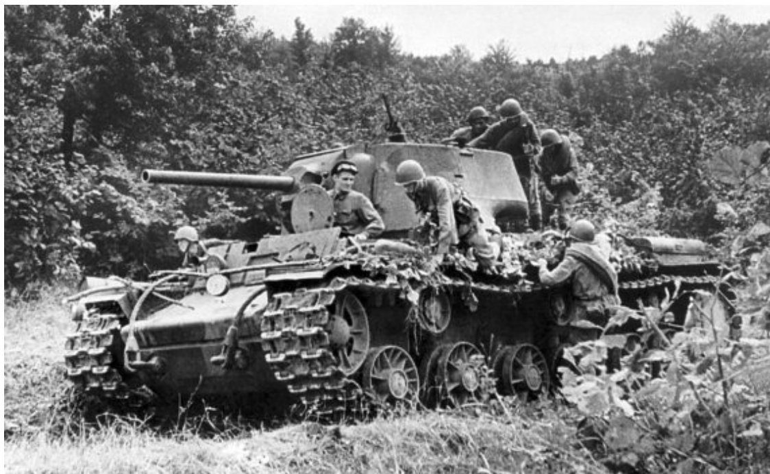
Танковый десант занимает места на танке «КВ-1»