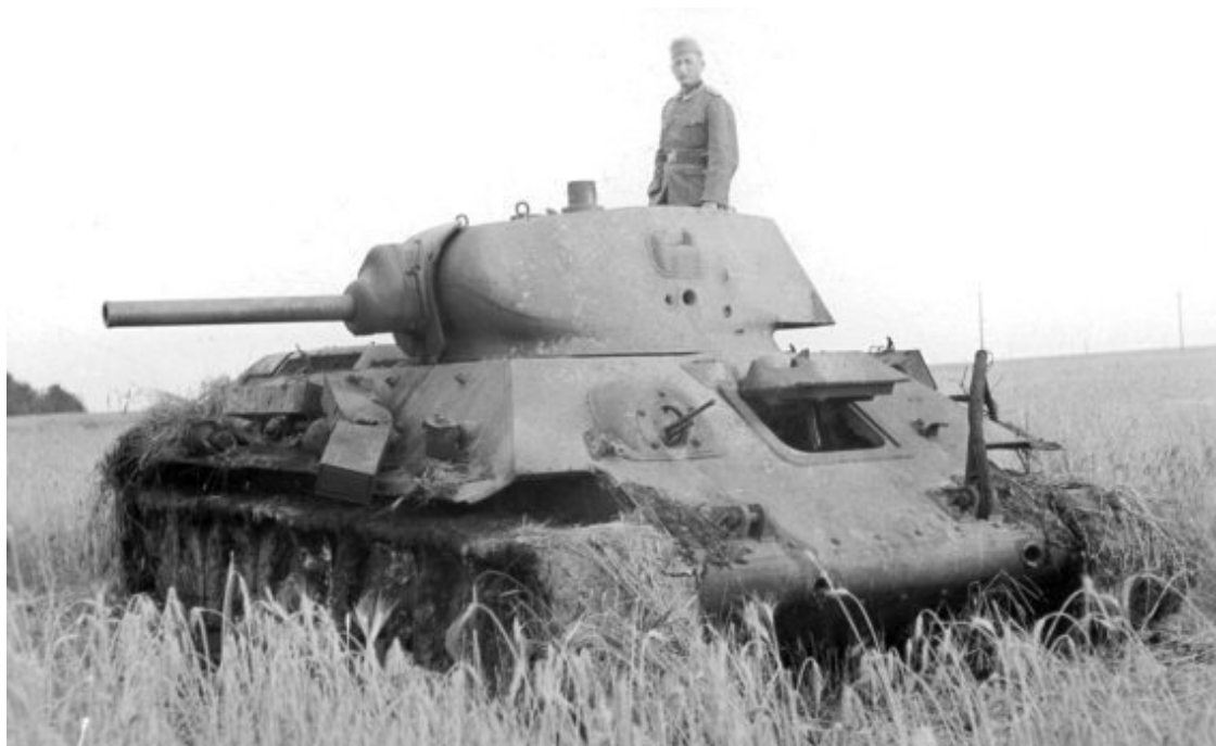
Подбитый радиальный танк «Т-34». Любопытны два попадания в носовую балку. Район неизвестен

Тем не менее, 1943 год был для советских бронетанковых войск все еще периодом учебы. Однако другим козырем советских танкистов было то, что средний танк «Т-34», выпускавшийся с 1940 года, к этому периоду войны уже стал основной боевой единицей бронетанковых войск Красной Армии.