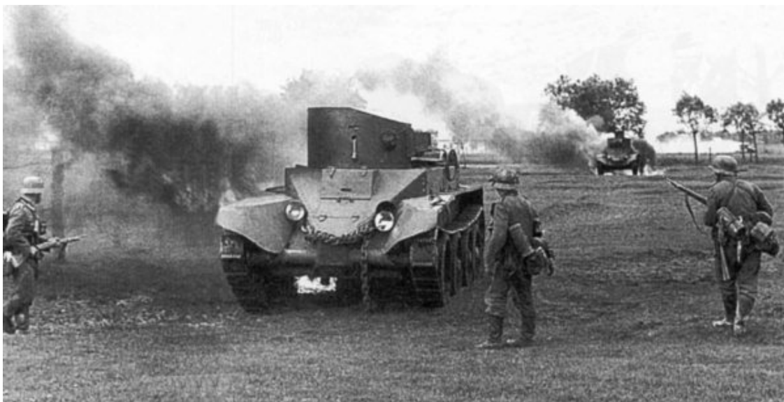
Подбитые танки «БТ». На переднем плане «БТ-2», на заднем «БТ-5»

Нанесением внезапных ударов танками во взаимодействии с авиацией гитлеровцы добились таких темпов наступления, которые оказались неожиданными для их противников. Эти и другие факторы позволили немецким войскам достичь на Западе крупных успехов, в том числе и завоевать Францию, армия которой недооценивала новейшие средства ведения войны, и в частности танковые войска.