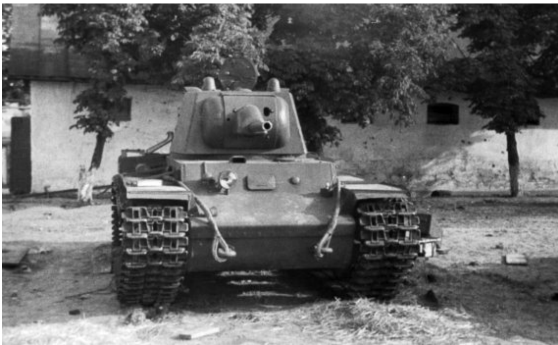
Оставленный в парке танк «КВ-1» первых серий: орудие «Л-11», pistolный порт вместо курсового пулемета у стрелка-радиста. Львов, июнь 1941 года

По окончании обучения выпускники сдавали экзамены приемной комиссии. По результатам этих экзаменов до 1943 г. присваивалось звание «лейтенант» – сдавшим экзамены на «хорошо» и «отлично» или «младший лейтенант» – сдавшим экзамены на «удовлетворительно». С лета 1943 г. всем выпускникам стали присваивать звания «младший лейтенант». Кроме этого комиссия проводила аттестацию, по результатам которой выпускника могли назначить командиром взвода или командиром линейного танка.