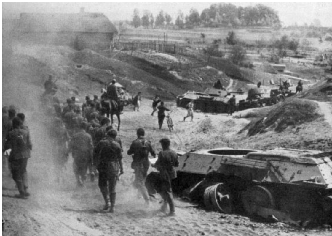
Немецкие солдаты проходят мимо уничтоженной внутренним взрывом «тридцатьчетверки». На заднем плане видны брошенные «Т-34» и «Т-26»

В марте 1941 года по предложению начальника Генерального штаба Г. К. Жукова правительство утвердило план по развертыванию еще 21 механизированного корпуса. По этому плану Красная Армия должна была иметь 61 танковую дивизию (в том числе три отдельные) и 31 моторизованную (в том числе две отдельные). Для обеспечения новых формирований требовалось уже около 32 тыс. танков, в том числе 16,6 тыс. танков «Т-34» и «КВ». Чтобы выпустить необходимое количество боевых машин при существовавшей в 1940–1941 годах мощности танковой промышленности, даже с учетом привлечения новых предприятий, таких, как Сталинградский и Челябинский тракторные заводы, требовалось не менее четырех-пяти лет.