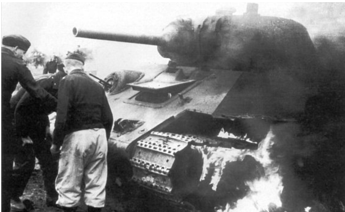
Немецкие солдаты осматривают подбитый танк «Т-34»