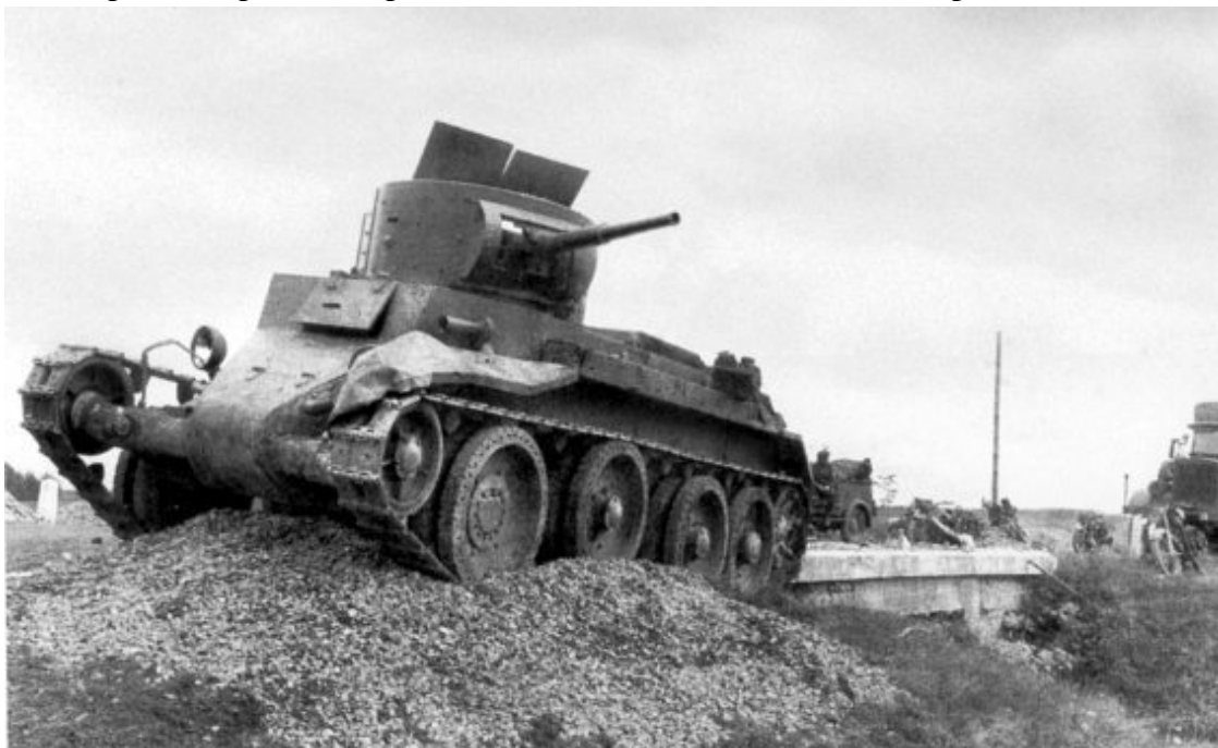
Подбитый «БТ-5» в районе Дубно