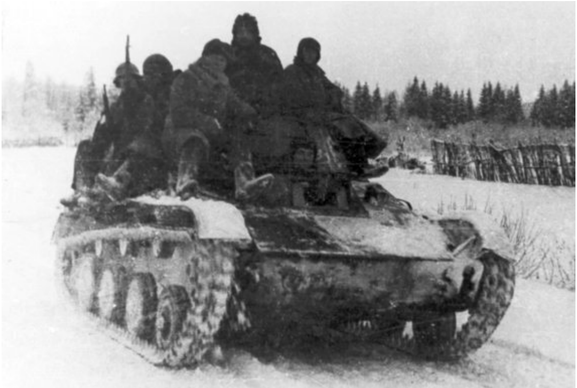
«Т-60» движется к фронту. Зима 1941 год