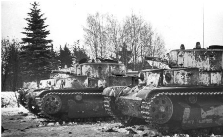
Танки «Т-28» перед атакой. Карельский перешеек, февраль 1940 года