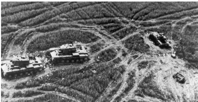
Подбитые танки «КВ-1» и немецкий «Pz-III»

ствии с авиацией гитлеровцы добились таких темпов наступления, которые оказались неожиданными для их противников. Эти и другие факторы позволили немецким войскам достичь на Западе крупных успехов, в том числе и завоевать Францию, армия которой недооценивала новейшие средства ведения войны, и в частности танковые войска.