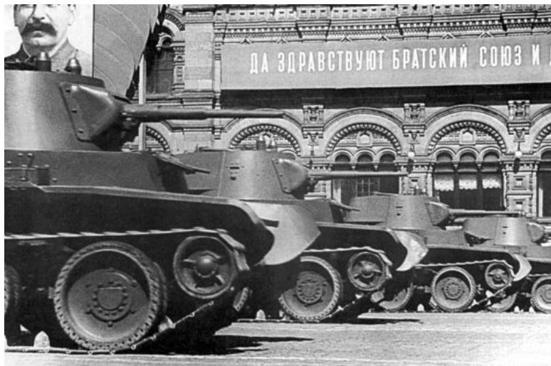
Танки «БТ-7» на первомайском параде. Танки «БТ» и

ка, и танки наши быстры». «Горячие денечки» рассказывают о танковом экипаже, остановившемся для ремонта в деревне. Главный герой – командир экипажа. Он – бывший пастух. Только служба в армии открыла перед ним широкие перспективы. Теперь его любят самые красивые девушки, на нем роскошная кожаная куртка (до середины 30-х годов советские танковые экипажи носили черные кожаные куртки, из «царских» запасов). Разумеется, в случае войны герой будет громить любого врага с той же легкостью, с какой покорял женские сердца или достигал успехов в боевой и политической подготовке.