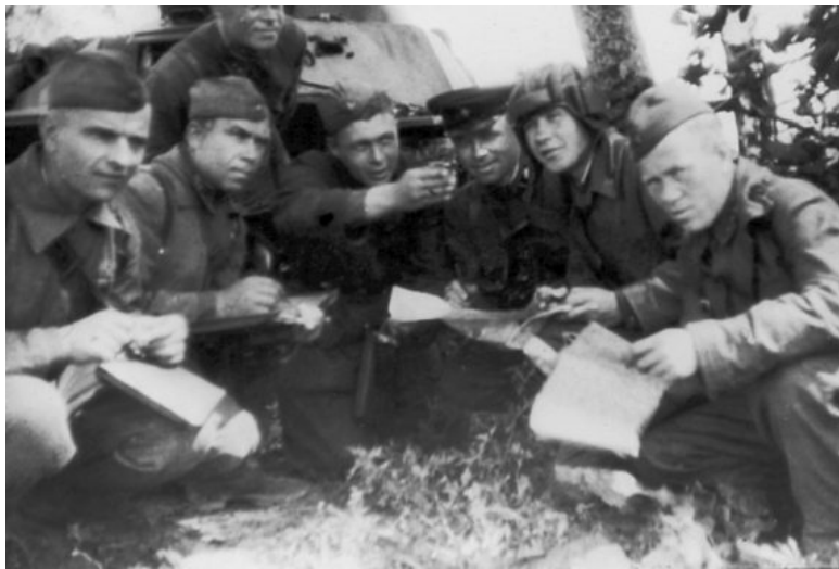
Постановка задачи на фоне танка «Т-40»

женной: ему нужно было толкнуть требуемый снаряд в казенник пушки и выбросить гильзу через люк после ее экстактирования. По утверждению В.П. Брюхова, заряжающим мог быть любой физически крепкий автоматчик – объяснить молодому человеку отличие в маркировке бронебойного и осколочно-фугасного снаряда не составляло труда. Однако напряжение боя бывало иногда таким, что заряжающие падали в обморок, надышавшись пороховых газов. Кроме того, у них почти всегда были обожжены ладони, поскольку выбрасывать гильзы требовалось сразу после выстрела, чтобы они не дымили в боевом отделении.