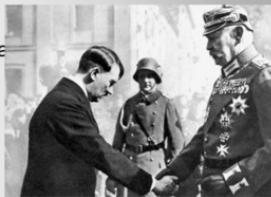
А. Гитлер и П. Гинденбург

Приход Гитлера к власти в Германии.