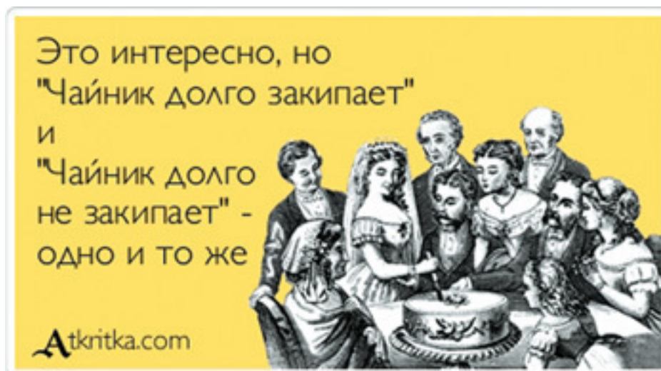
Рис. 1. Кстати, так называемые «Аткрытки» показывают феноменальную живучесть – такой формат контента уже несколько лет хорошо воспринимается аудиторией

Когда я пишу «по возможности оригинальная», это не обязательно означает «нигде, никогда и никем не опубликованная ранее». Все далеко не так. «Оригинальная» в данном случае – это скорее «вписанная в ваш поведенческий почерк». К примеру, если вы написали статью и опубликовали ее, а потом (через несколько месяцев) ее повторяете – это все равно оригинальный контент в определенном смысле. Даже если вы просто публикуете тематические цитаты из книг классиков, но оформляете их особым узнаваемым образом (к примеру, на картинках с ватермаркой), то подходит и это.