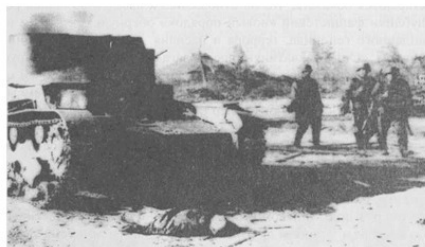
Фашистские захватчики в одном из оккупированных селений.

В первые недели войны начальнику генерального штаба сухопутных войск Германии доносили, что обеспечению группы армий «Центр» мешает «разрушение партизанами железнодорожных путей». В ответ в июле-августе 1941 г. немцы провели карательную акцию под названием «Припятские болота», в ходе которой было убито почти 14 тыс. человек, в основном мирных жителей. В трудных условиях зимы 1941—1942 гг. продолжали действовать 200 партизанских отрядов и групп.