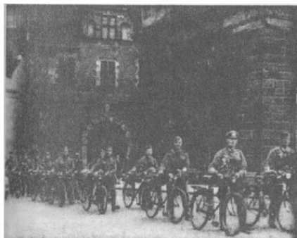
Гитлеровский содаты – покорители Европы

22 июня 1941 г. немецко-фашистские захватчики вторглись на территорию нашей Родины, началась Великая Отечественная война народов Советского Союза за свою свободу и независимость.