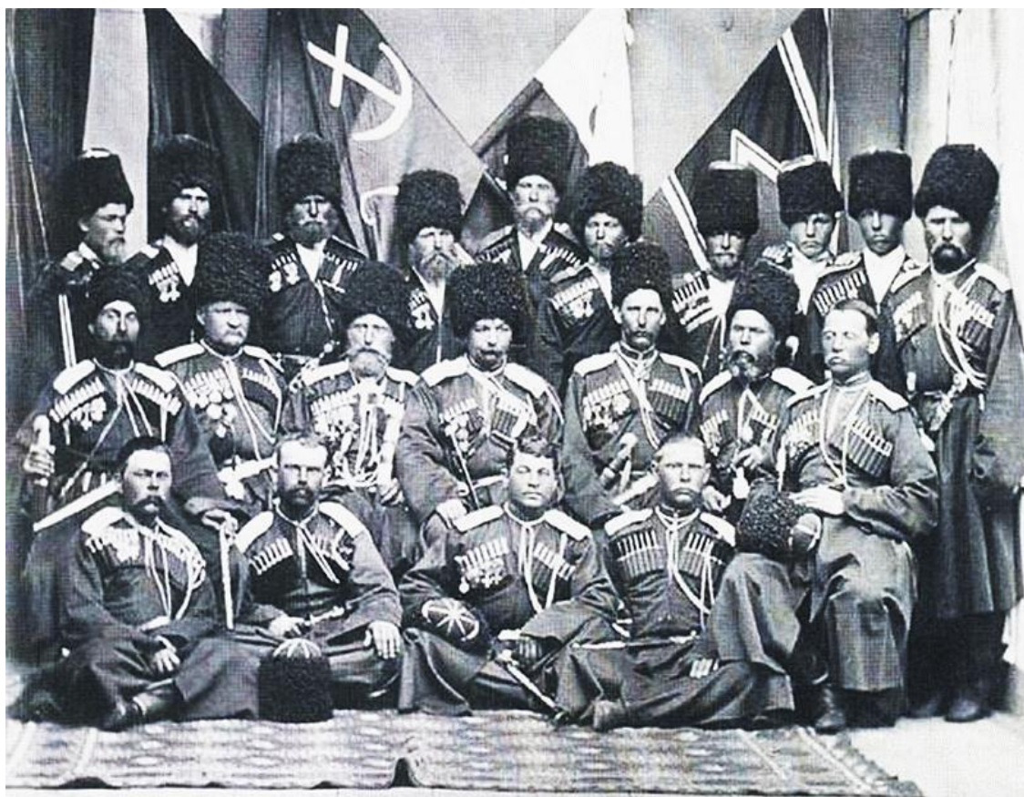
Терские казаки, XIX век

Особым восхищением среди служилых людей слыла атака казачьей конницы – лава, позволявшая верховым сотням стремительными маневрами проникать в боевые порядки противника, рассекая их на малые части, лишая командной управляемости.