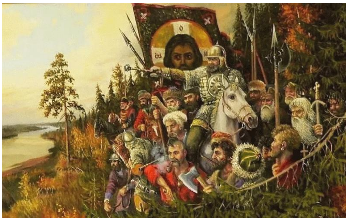
Покорение Ермаком Сибири

Общаясь с коренными жителями, он заключал с князьками сибирских племён соглашения о взаимовыгодном сотрудничестве их с русским царством. В свою же очередь старался обезопасить малочисленные народности от коварных набегов разрозненных и озлобленных племён азиатского хана.