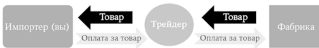
Рис. 2. Схема работы импортера с трейдером

● Из-за отсутствия контроля производства и качества может возникнуть ситуация, когда посредник даже не знает, где делают ваш товар. Назначенная им фабрика из-за жестких сроков или занижения цен может отдать ваш заказ на субконтрактное производство другой фабрике, качество производства у которой ниже. В таком случае очень высок риск получения товара, совсем не соответствующего вашим требованиям; его и продать-то будет невозможно, никто не купит. Понятно, что, если вы работаете с фабрикой напрямую, эта проблема тоже не исключена. Однако вы можете проконтролировать производство, отправив на место инспектора по качеству или приехав сами, и при выявлении проблем еще до того, как заказ полностью выполнен, попытаться как-то их решить. В случае же с трейдерами, если они не раскрывают сведений об основной фабрике, вы будете лишены возможности провести такую проверку.