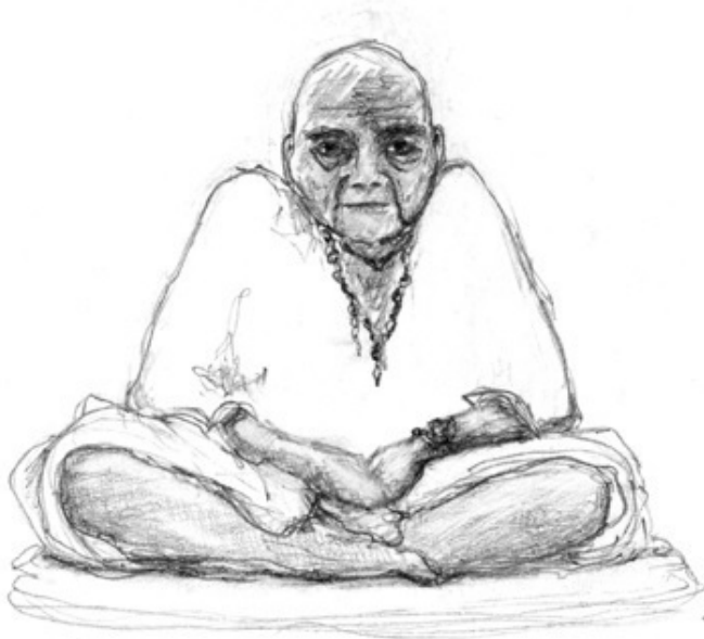
Кабеза Релампагея. Иллюстрация Керт Вильяло.

Через несколько секунд в хижину вошел местный мальчик лет четырнадцати, одетый в одни только шорты синего цвета. У него была светлая, почти белая кожа, сильные руки и ноги, темно-коричневые волосы и грустные голубые глаза. Новоприбывший не спеша подошел к вождю и стал обмениваться с ним короткими фразами на языке, напоминавшем