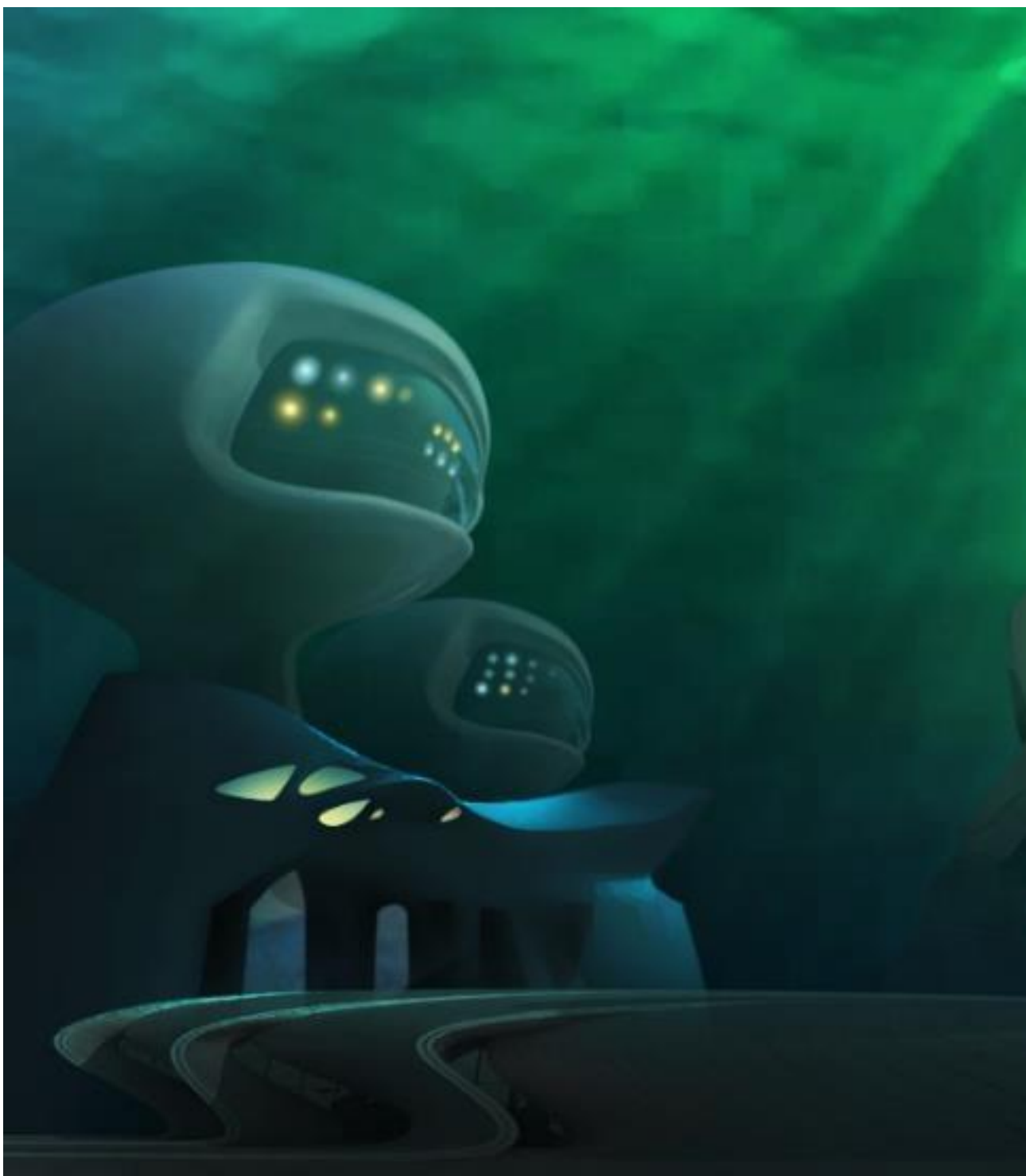
Реконструкция по описанию.