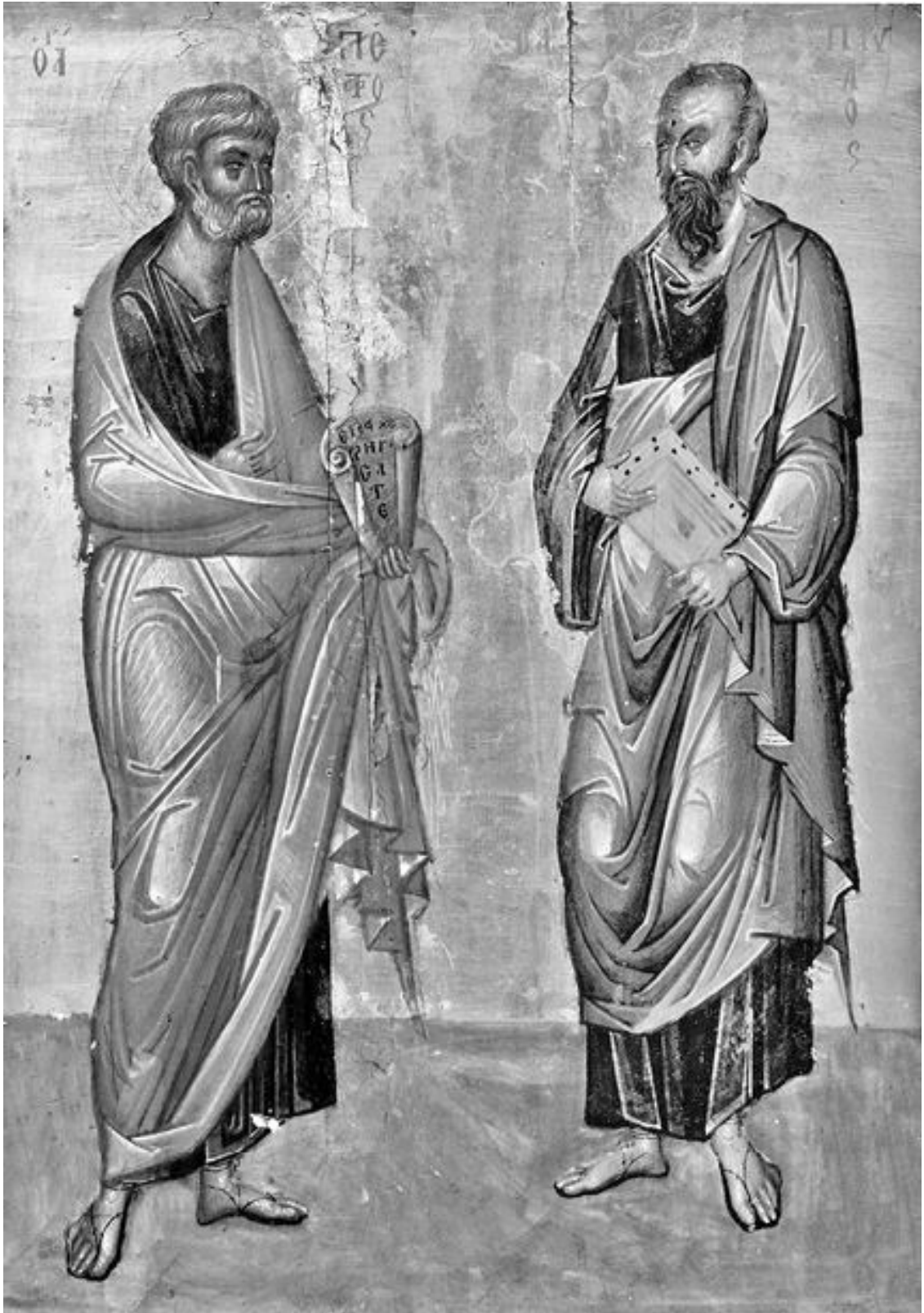
Апостолы Петр и Павел. Икона. Монастырь Св. Екатерины на Синае. XIV в.

Учитывая то, что пришли к вере в Мессию и к проповеди о Нем эти апостолы совершенно по-разному и опыт жизни у них до апостольства радикально различен, это единство тем в проповеди говорит о едином источнике вдохновения – Духе Святом.