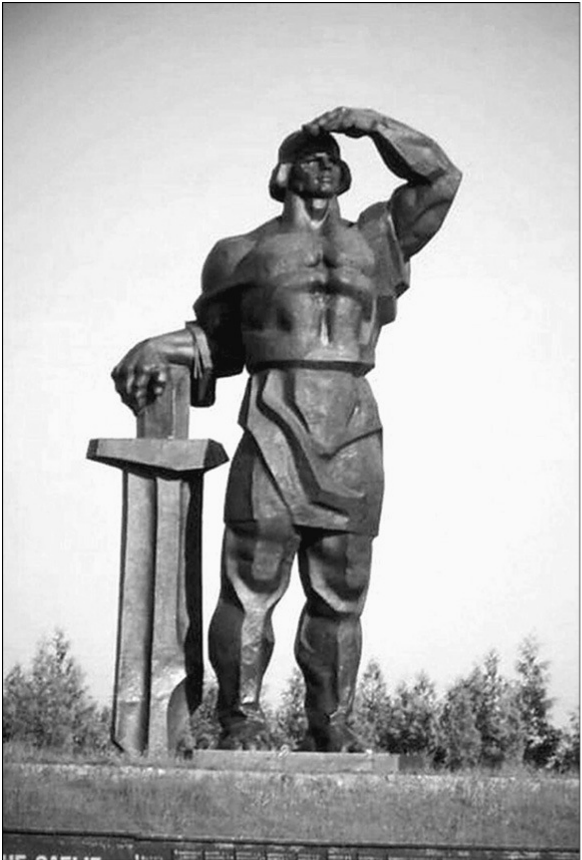
Огненное восхождение святого пророка Илиш. Фреска XIX в. Рыльский монастырь, Болгария

Черт под ясень спрятался, а Бог – трах в него молнией! Так ясень и зажегся. Адам сохранил тот огонь, и по нынешний день мы его имеем.