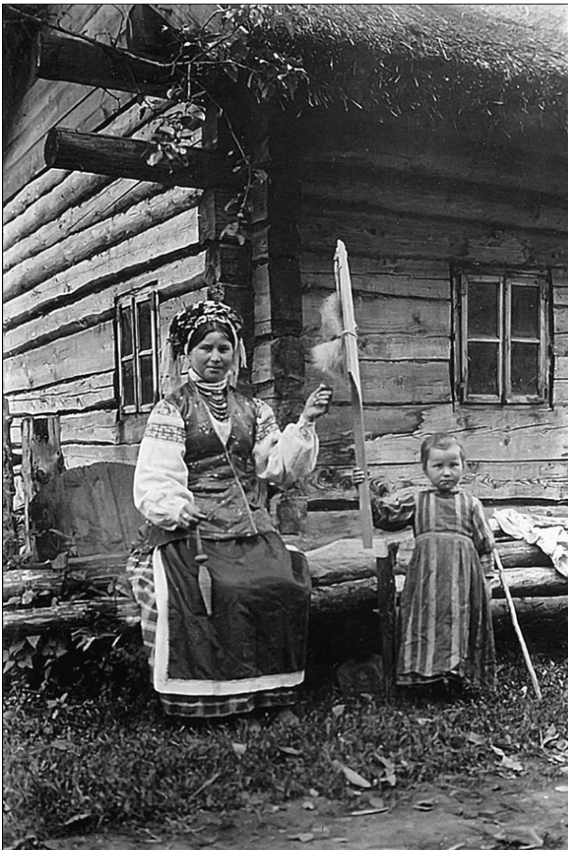
Старик и старуха. Минская область

Ну, ночь настала, сын в лес поехал снова, взял отца и привез домой. Через год случилось, что град жито побил и нечего было даже посеять. Сын и говорит отцу: