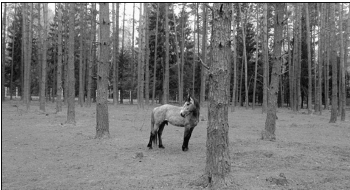
Памятник «Асилок» – символ белорусского народа в г. Свислочь

Один полуночник услышал необычный шум, подошел к тому месту и был настолько поражен всем увиденным, что испугался и нечаянно вскрикнул. Силачи заметили его, ничего ему не сделали; только очень просили уйти и никому не рассказывать о том, что он видел. Полуночник не сдержал своего слова, скоро весь город узнал о силачах, отчего сразу иссякла их волшебная сила.