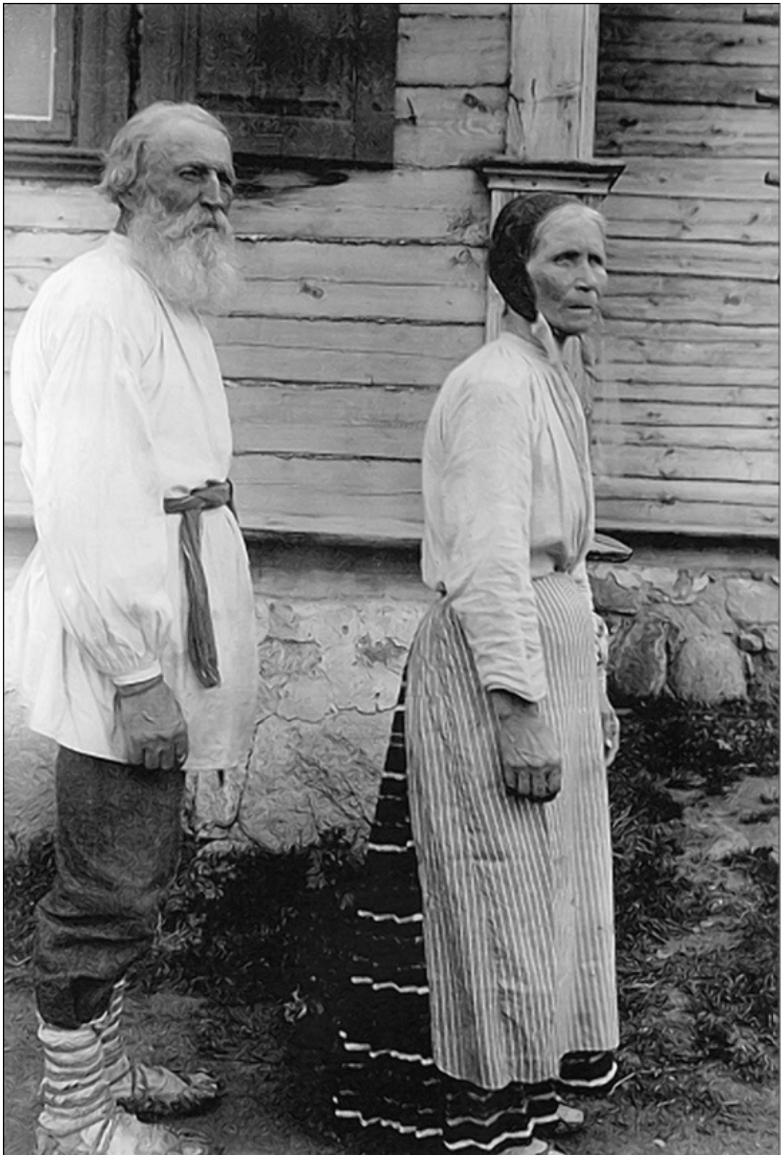
Семья полещуков у своего дома

Ехали они, ехали, доехали до большой реки. Осмотрели реку – всюду она глубокая, нигде нет удобного места, чтоб переехать вброд. А тут такая буря поднялась, что лес, словно зверь, ревет. Ломает буря деревья, как соломинки, и бросает в реку. Плывут они по реке целыми