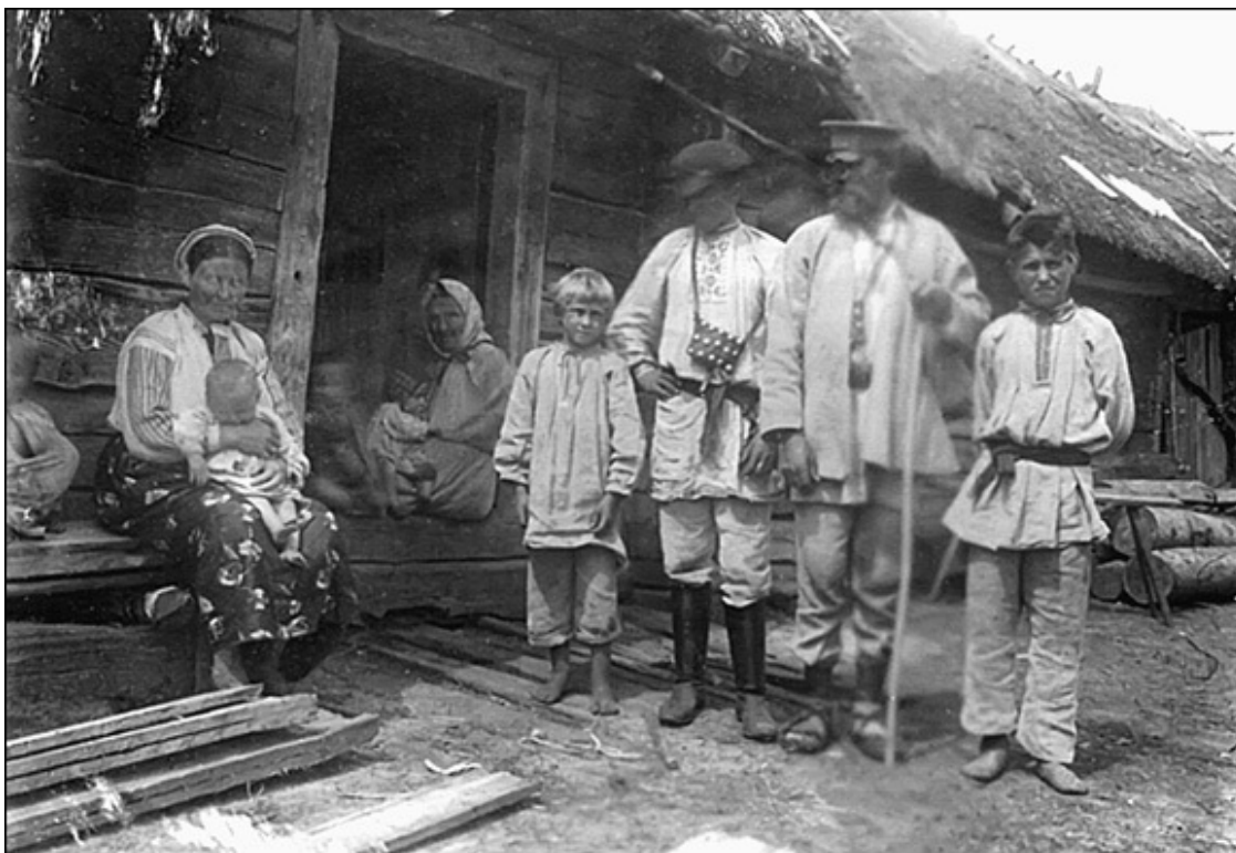
Руины замка в г. Лида

Случилось это еще во времена, когда в Литве господствовало язычество. Пришли сюда девять монахов-францисканцев проповедовать христианскую религию. Однако литвины, не желая принимать христианство, убили этих миссионеров, а трупы их бросили в яму на склоне Лидского замка. На этом месте, не саженные, выросли две сосны, которых литовцы, уже ставшие католиками, не трогали.