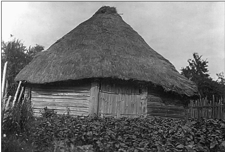
Крестьянка с прялкой