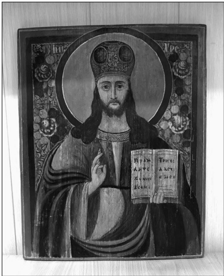
Господь Вседержитель. Икона