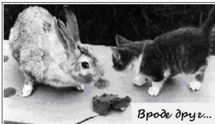
Дивизионный городок 1979 год

Из домашней живности остался только кот.