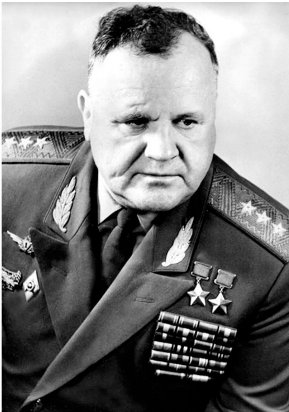
Николай Дмитриевич Гулаев

Командиры перед конференцией лейтенанту вопрос указали, а ответ генералу нет. Очевидно, поэтому Гулаев оживился.