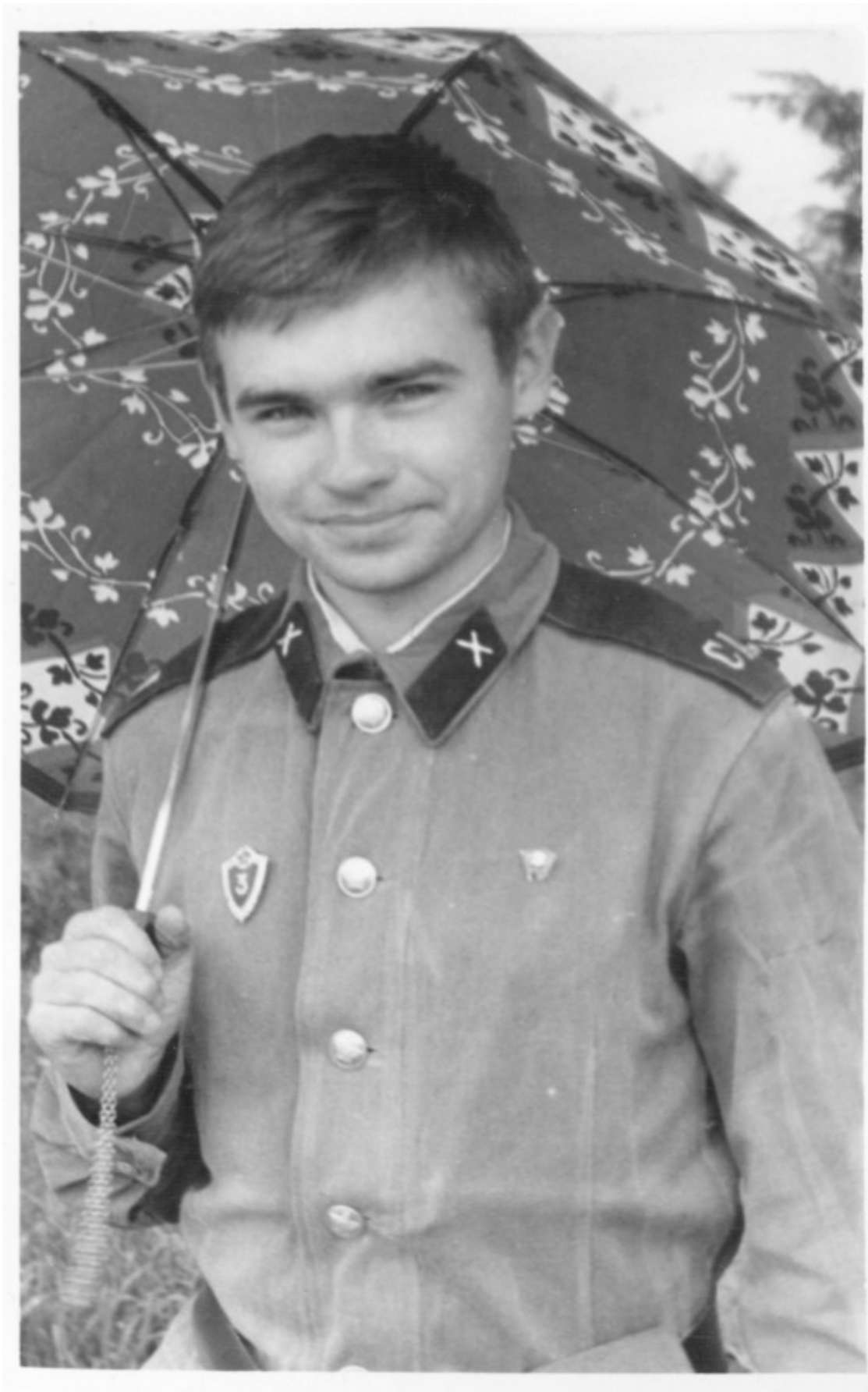
Родители приезжали еще летом, я сфотографировался под зонтиком