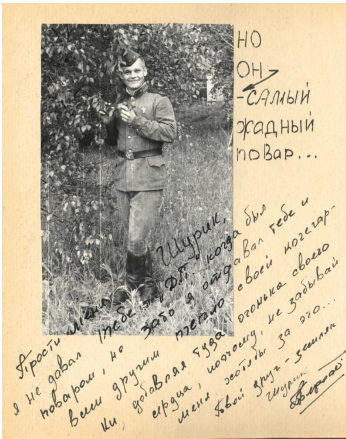
Из дембельского альбома

За этим одно удовольствие наблюдать, и никакой нужды вставать рядом помогать – только мешать будешь. Что он плохо делал, так это злился, ругался, возмущался – это не его. Повздыхать – это нормально, но улыбка с лица не сходила. Давно его не видел, надеюсь он такой же.