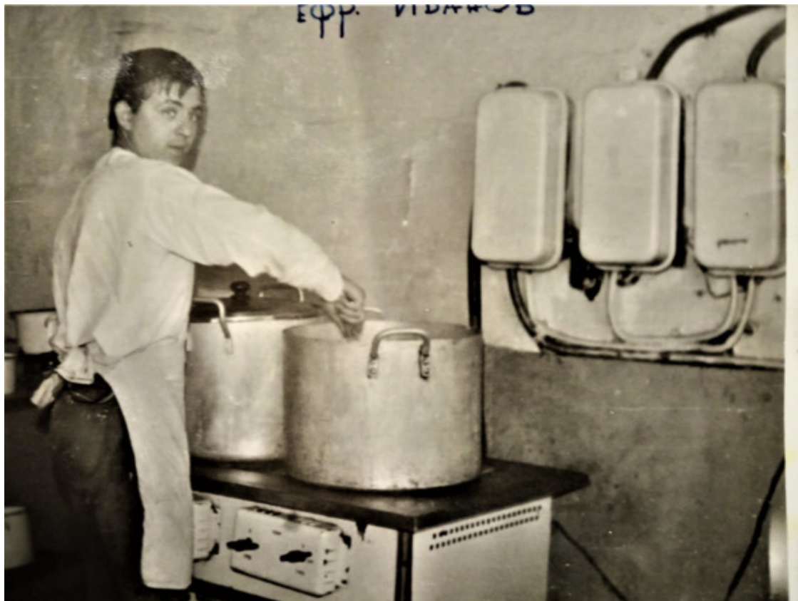
На кухне дивизиона

Однако и отступить от сказанного я не собирался.