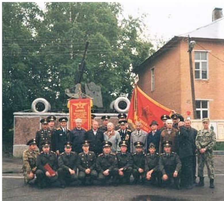
Церемония прощания с боевым Знаменем части