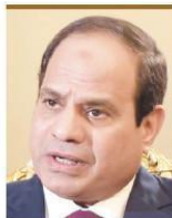
Абдель Фаттах Ас-Сиси