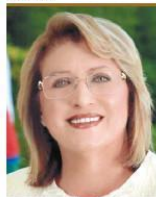
Мари-Луиз Колейро Прека