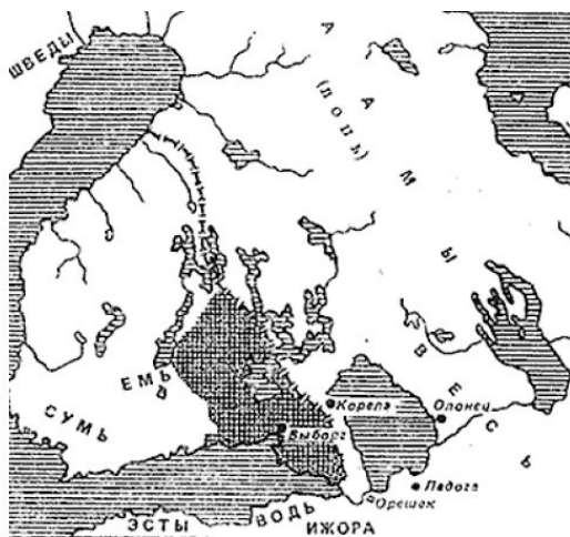
Рисунок 3. Граница 1323 г. и карельские (новгородские) погосты, отошедшие к Швеции. Из книги Шаскольского И. П. [82]

На рис. 3. приведена карта из книги Шаскольского И. П. [82], показывающая границу по «Ореховскому мирному договору 1323 года» и карельские (новгородские) погосты, отошедшие к Швеции.