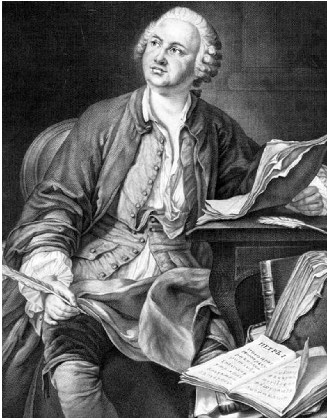
Э. Фессар. Портрет Ломоносова. Гравюра 1757 г.