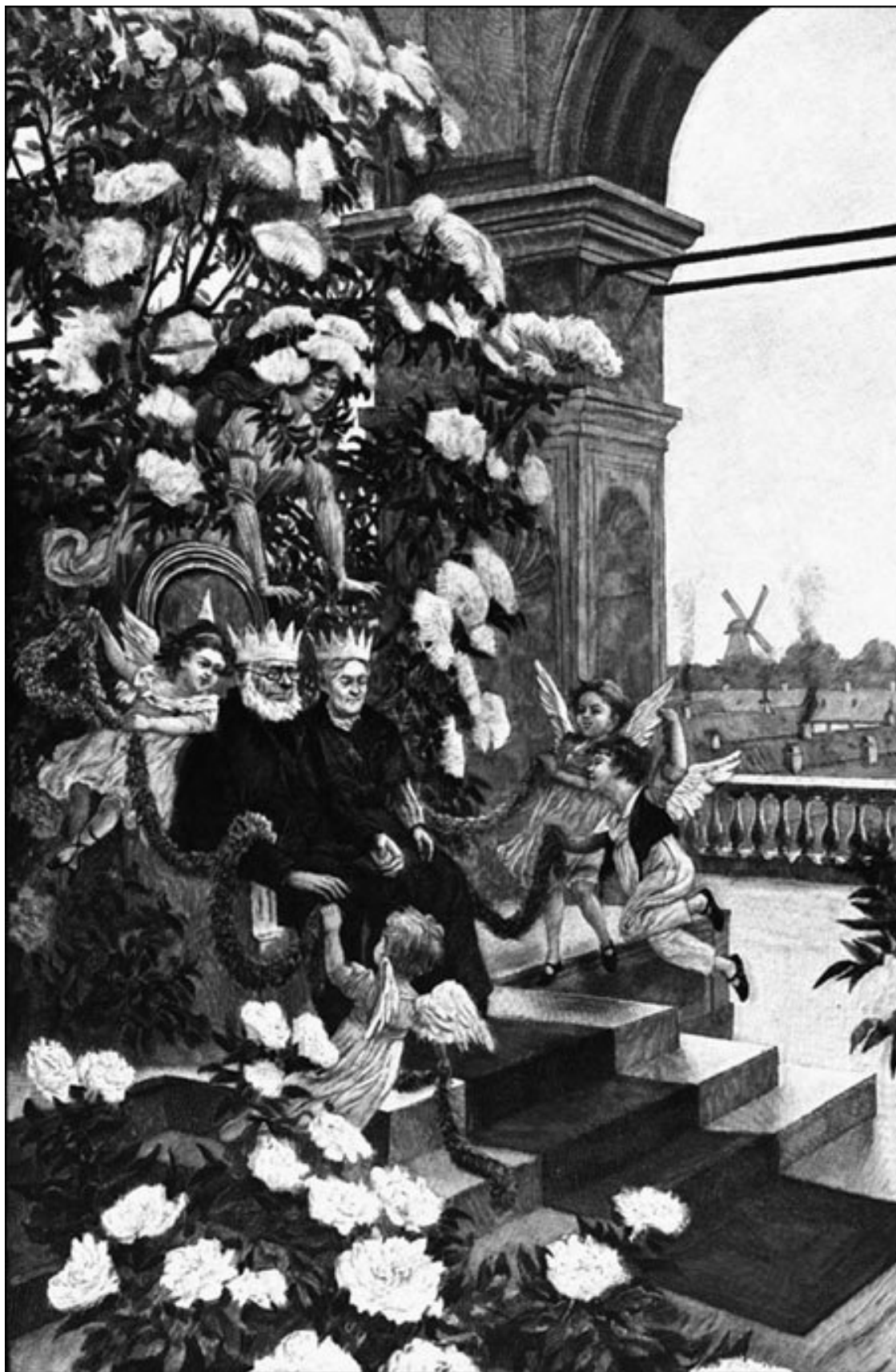
Бузинная матушка. Иллюстрация Х. Тегнера (1913). Апофеоз благодушия и довольства

Для такого междусобойчика Андерсену и нужны были волшебные существа. Они вели себя по-человечески, дружески болтали или угрюмо отмалчивались. Г. Гейне вспоминал, как