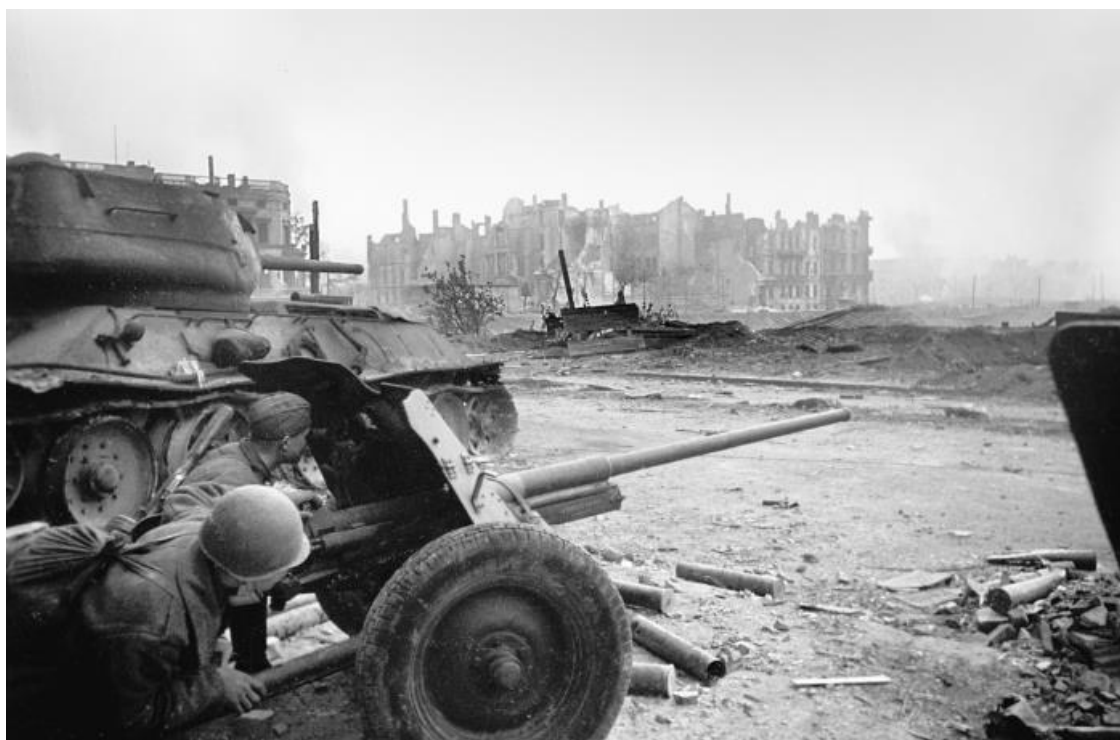
Бой на подступах к Рейхстагу. Берлин

В этот день на всех фронтах подбито и уничтожено 50 немецких танков и самоходных орудий. В воздушных боях и огнем зенитной артиллерии сбито 40 самолетов противника.