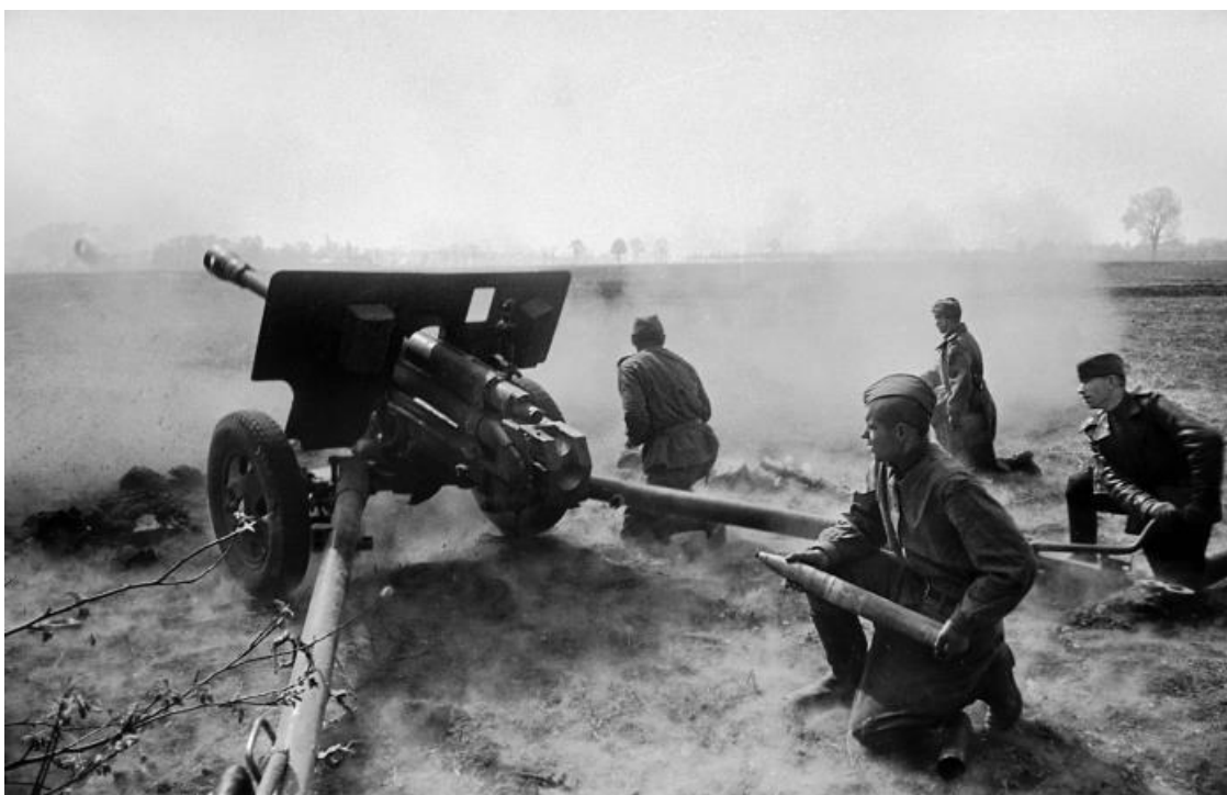
Орудийный расчет ведет бой на окраине города. 1-й Белорусский фронт

Войска союзников на Западном фронте заняли города Меппен, Линген, Гамм, Эйзенах.