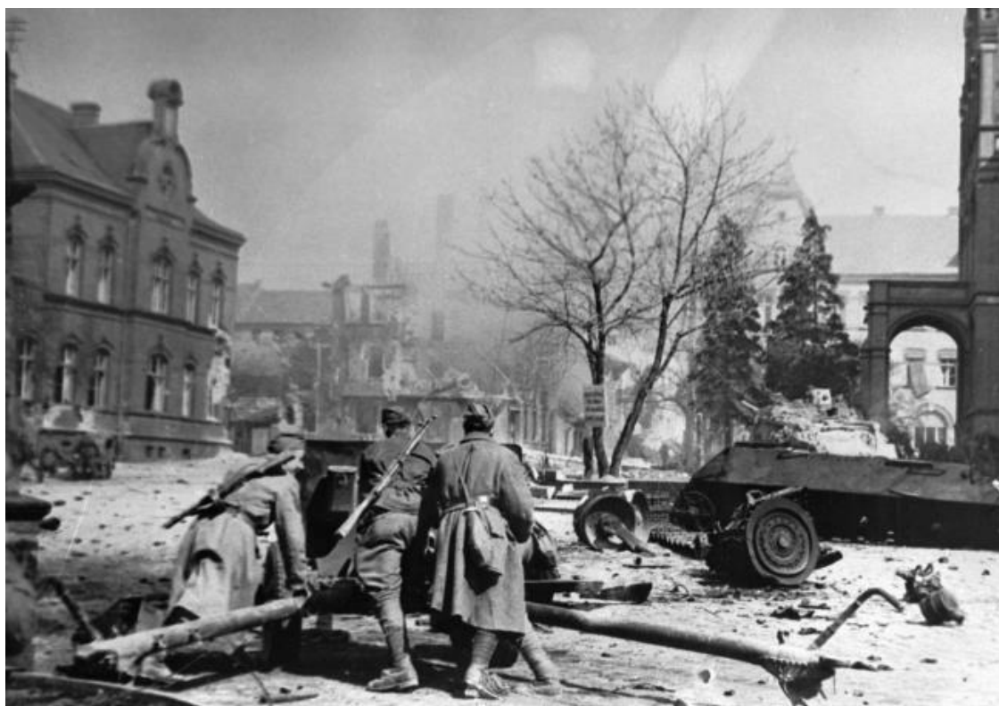
Котбус-Потсдамская операция.

1-й Украинский фронт получил директиву Ставки ВГК о проведении наступательной операции с целью разгрома группировки противника в районе Котбус и южнее Берлина.