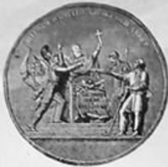
Медь в. 1812. Диаметр 40 мм.