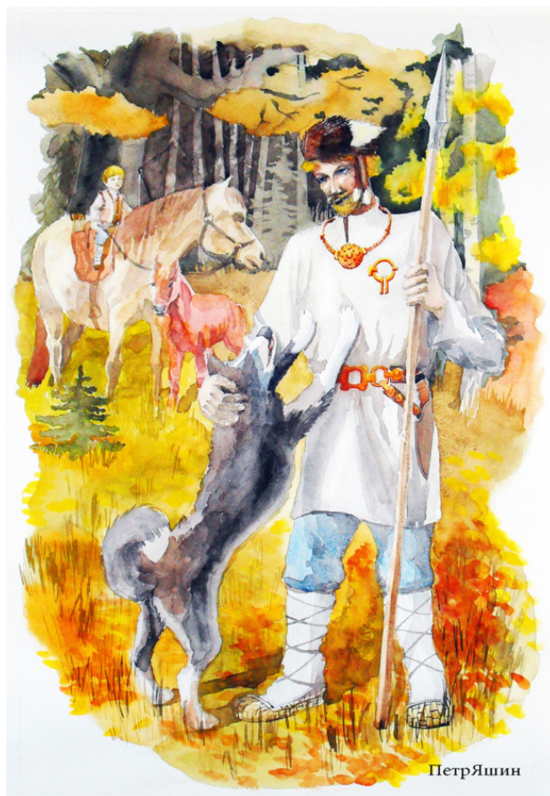
ИЛ. 1 Мордвин