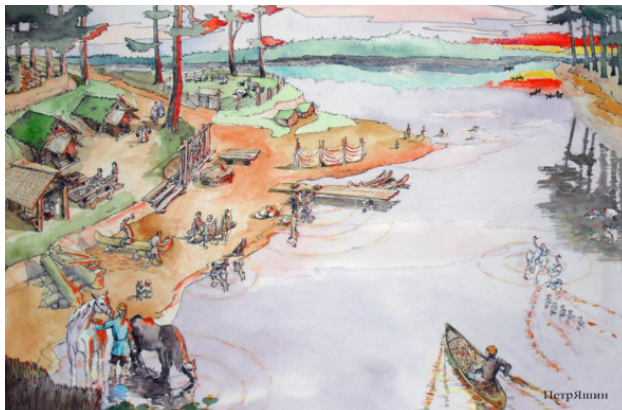
ИЛ. 3 Мордовское поселение

на которой со временем заколосились хлеба. Доказательство тому – очень много русских, слов в мордовском языке связанных с обработкой земли.