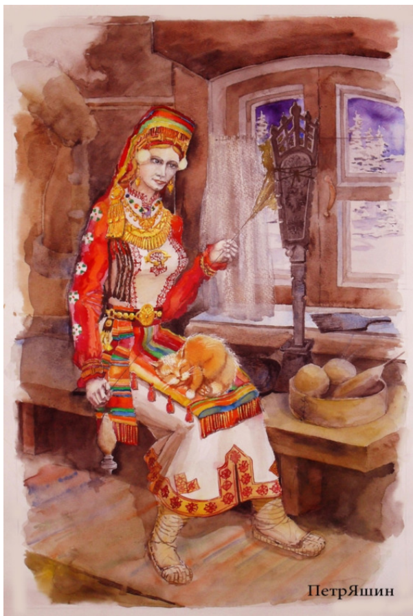
Ил. 5 Мордовская девушка

Вот так коротко можно охарактеризовать жизнь Мордвы в описываемый период начала XIII века.