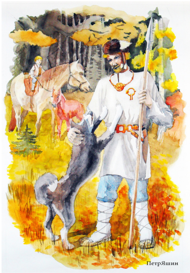
ИЛ. 1 Мордвин