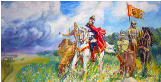
ИЛ. 6 Великий князь Юрий-II Всеволодович на Дятло-

«...В то же лето (1226 г. прим. А.П.) послал великий князь Юрий братьев своих Сятослава и Ивана на мордву, и победили мордву, взяли несколько сёл, и возвратилися с победой...» (ИЛ. 6)