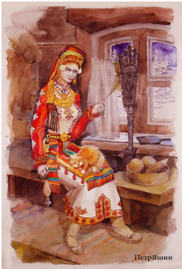
ИЛ. 5 Мордовская девушка

да. Здесь надо заметить, что изготовлением ювелирных украшений в основном занимались женщины. (ИЛ. 5)