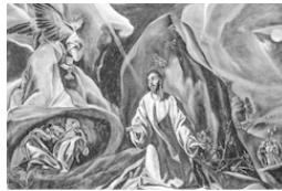
Моление о чаше. Эль Греко. 1605 г.

Мы молим Бога, чтобы Он дал нам светлые помыслы, чтобы у нас в уме горел огонь, как пламень свечи. Не будь же человеком, распространяющим вокруг себя мрак своими словами, мыслями, душевным состоянием, атмосферой, которую создаешь вокруг себя, проявлением своего характера и душевности, но чтобы, когда пойдешь куда-нибудь, ты излучал свет, чтобы ты говорил другому, а он бы радовался, смотрел оптимистично на вещи и говорил: «Мы сможем!»