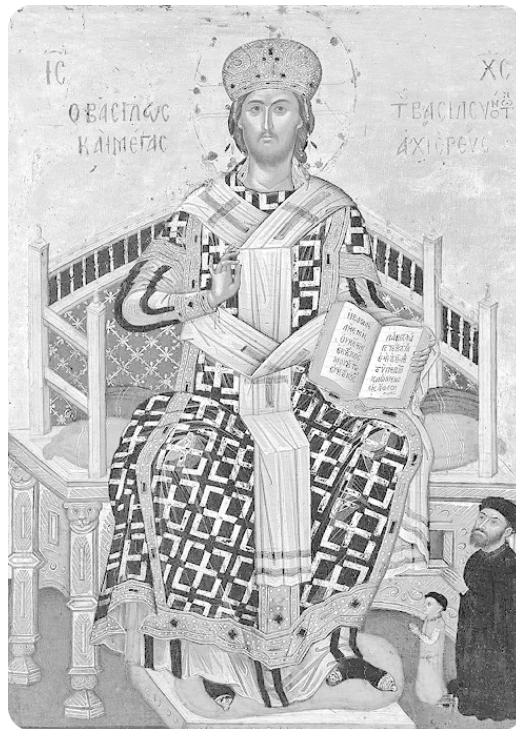
Христос – Великий Архиерей Икона. Греция. XVI в.

Это очень мощная молитва! В «Настольной книге духовных советов», в той книге, где говорится о хранении пяти чувств, то есть о том, как человеку защититься и духовно бодрствовать пятью своими чувствами, святой Никодим Святогорец говорит: «Советуйте людям в миру, верующим, чтобы они произносили Иисусову молитву. Она не для одних лишь монахов, а для всех» 1 .