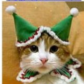
不思議の国のピエロにゃん