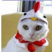
ハッピー!福酉にゃんセット