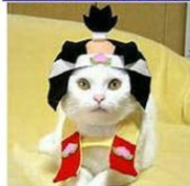
アッ!というまの桃太郎にゃん