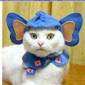
ぞうにゃん幼稚園へ行くセット