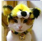
Go! Go! タイガーにゃん