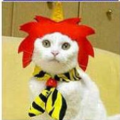
アッ!というまの鬼シリーズ