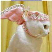
窓のキュービッド