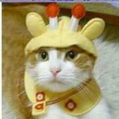
キリンにゃん幼稚園へ行くセット