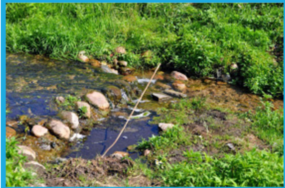
Река Кревлянка.