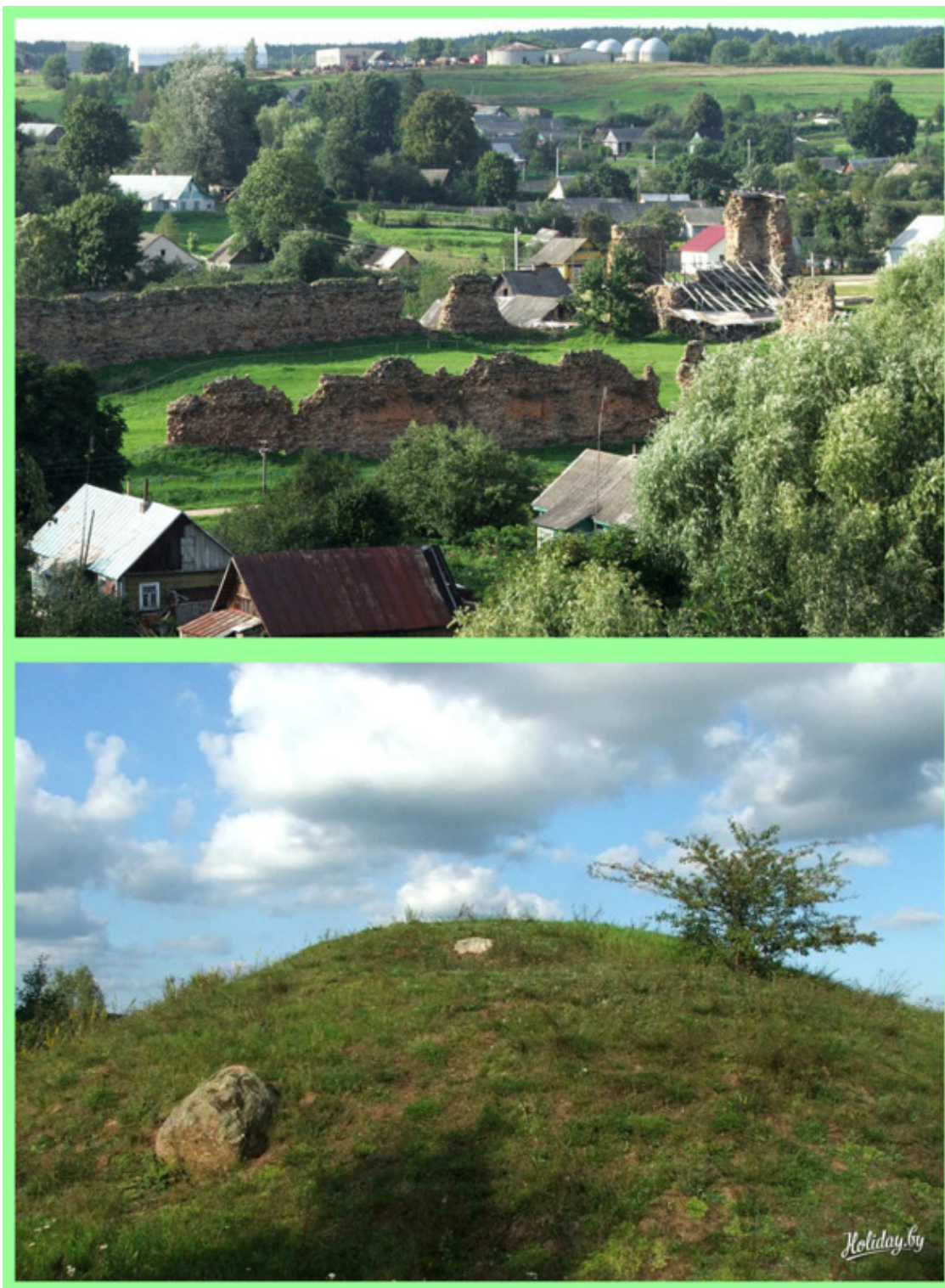
Деревня Крево. Юрьева гора (бывшее языческое капище).