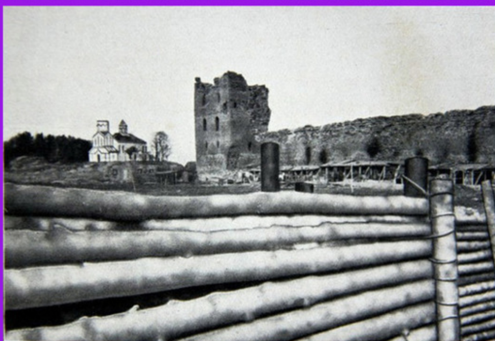
Zagellonenburg und griechisch-katholische Kirche in Krewo

Верхнее фото – Кревский замок и костел зимой 1915—1916 гг.