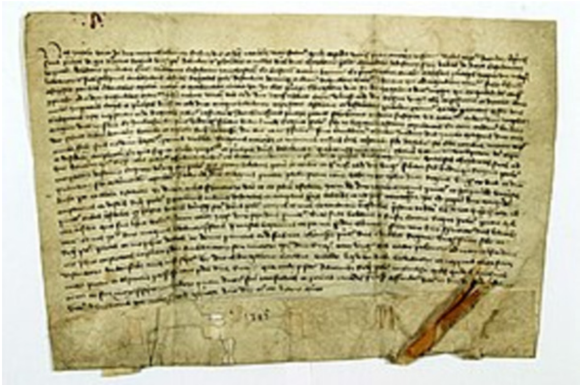
Текст Кревської Унії

Год 1413-й. Это был год вхождения местечка составной частью в Виленское воеводство.