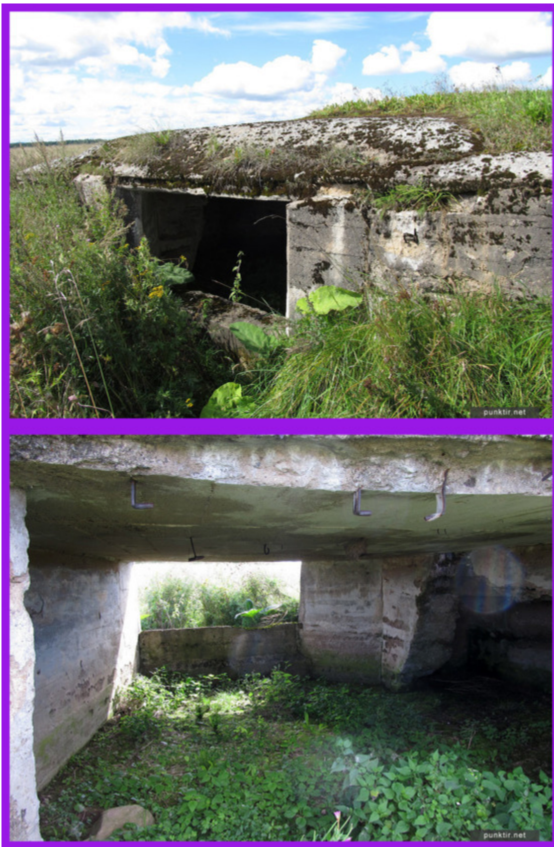
Амбразура полукапонира направлена в сторону Крево (вид снаружи и изнутри).