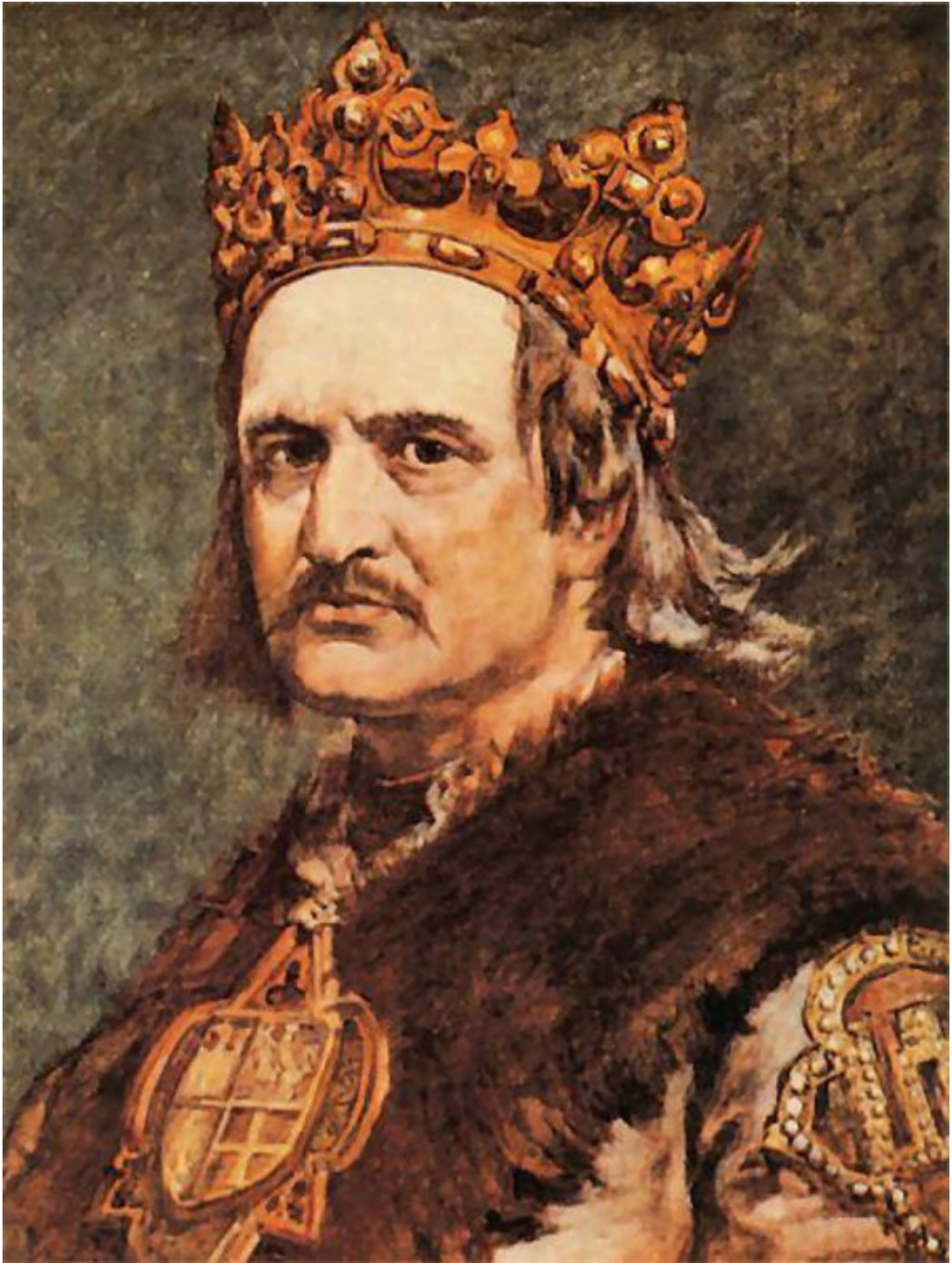
Владислав II Ягайло, Литовский князь, фото. Источник: https://www.turkaramamotoru.com/uk/Владислав-II-Ягайло-14309.html

Год 1382-й. В данном году Кейстута, отца великого князя Витовта, заключили здесь в тюрьму и в итоге убили.