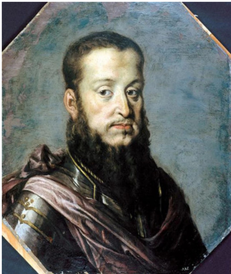
Великий князь Сигизмунд Август.